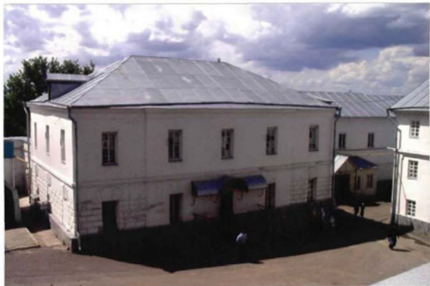
① Общий вид