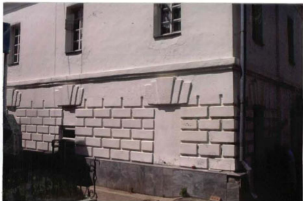
② Фрагмент фасада