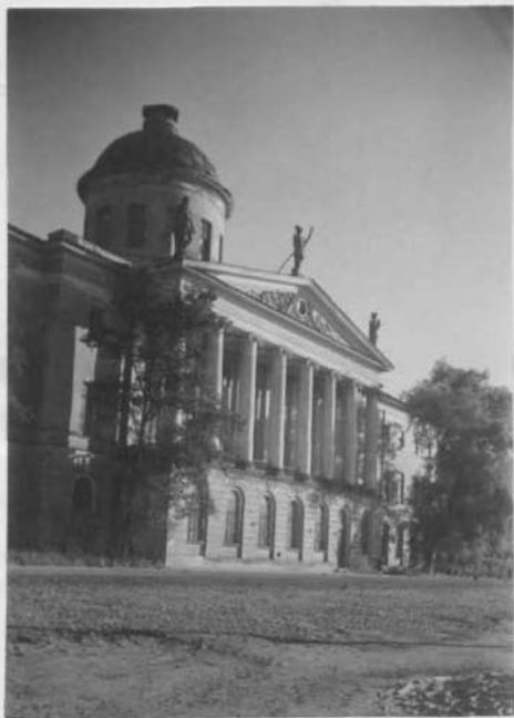
Портик главного фасада.