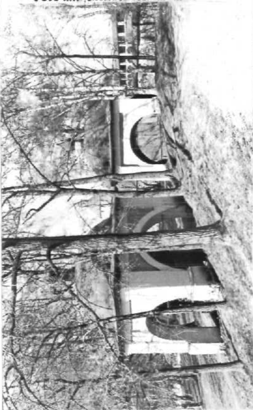
Фото или схематический рисунок