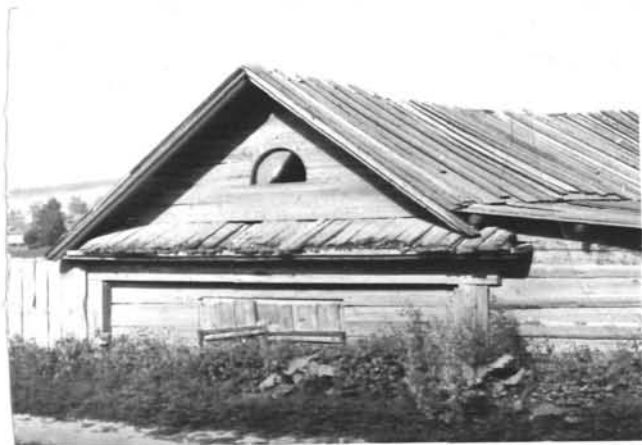
Фото или схематический план

Конный двор входит в состав крестьянской усадьбы сер. XIX века, расположен по лицевому фасаду и представляет собой бревенчатый сруб из круглых бревен диаметром 30-40 см., перекрытый двухскатной крышей с покрытием из теса. Парадный фасад обшит тесом из широких досок. Треугольный фронтон с полуциркульным чердачным окном отделен сложным карнизом с большим выносом от плоскости стены. Остальные фасады бревенчатые, без обшивки. Дверные проемы прямоугольной формы, косячатые двери одно и двухпольные из толстых досок. Сохранились первоначальные кованые железные детали. Общая длина - 10,3 м., ширина - 5,0 м.