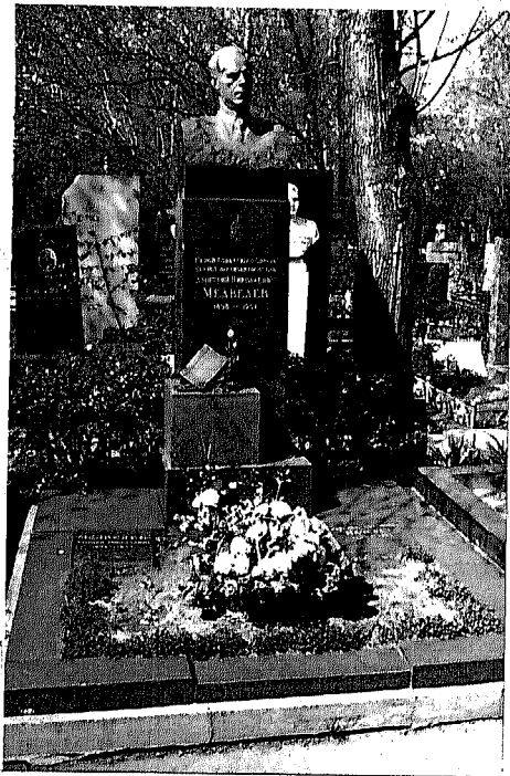
Фото или схематический план