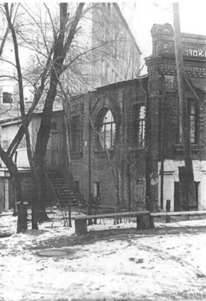
Фото Баклыского П.В., 1970 –е годы.