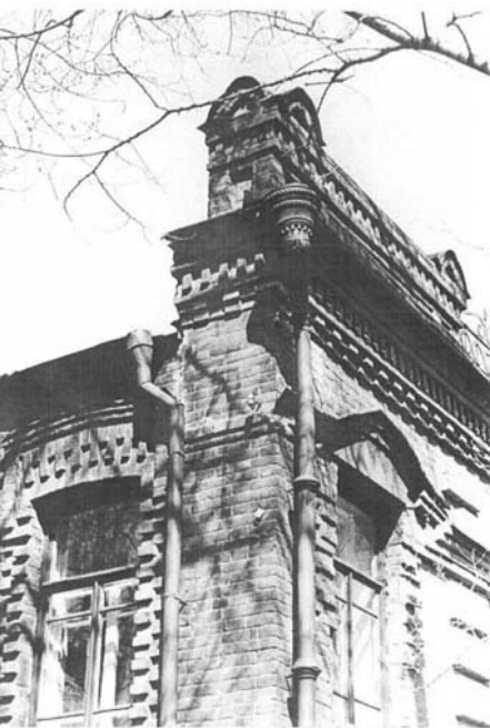
1970 –е годы.

г. Хабаровск, пер. Топографический, 10 Дом жилой Н.А. Сыромятникова, 1908 г. Вид на юго-западный угол здания