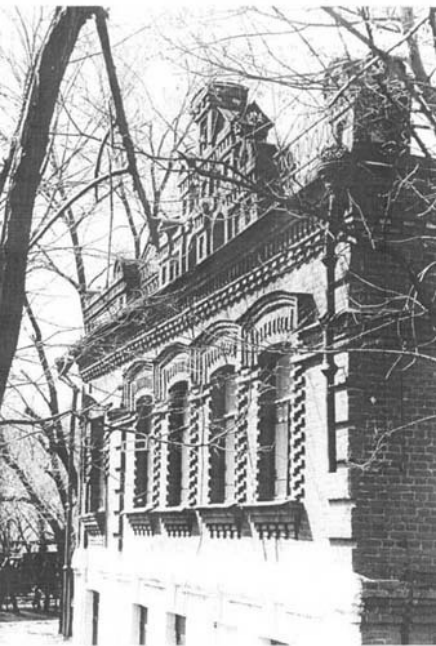
1970 –е годы.