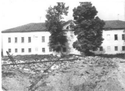
Фото или схематический план