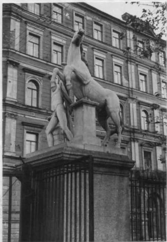
Северная конная Гвардия.