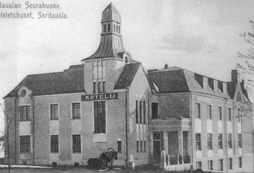
Sortavalan Seurahuone. Societetshuset, Sordavala.