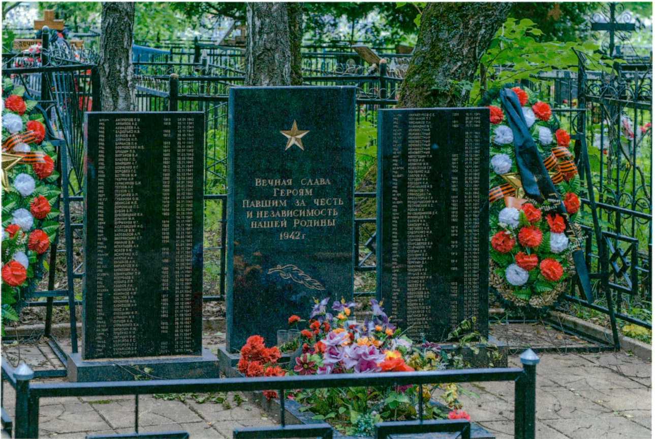
2. Вид с северо-запада