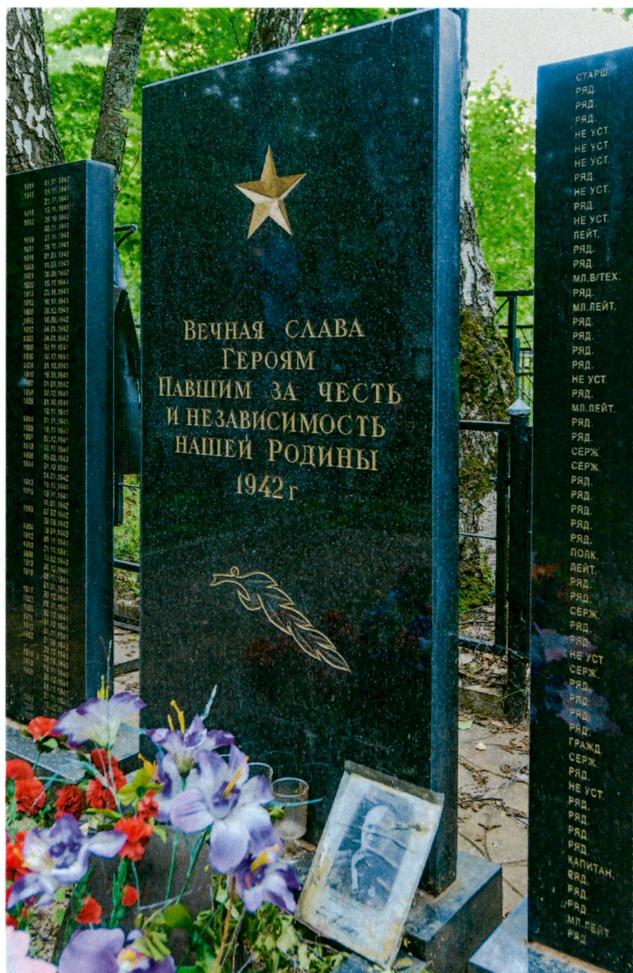
1. Вид с запада