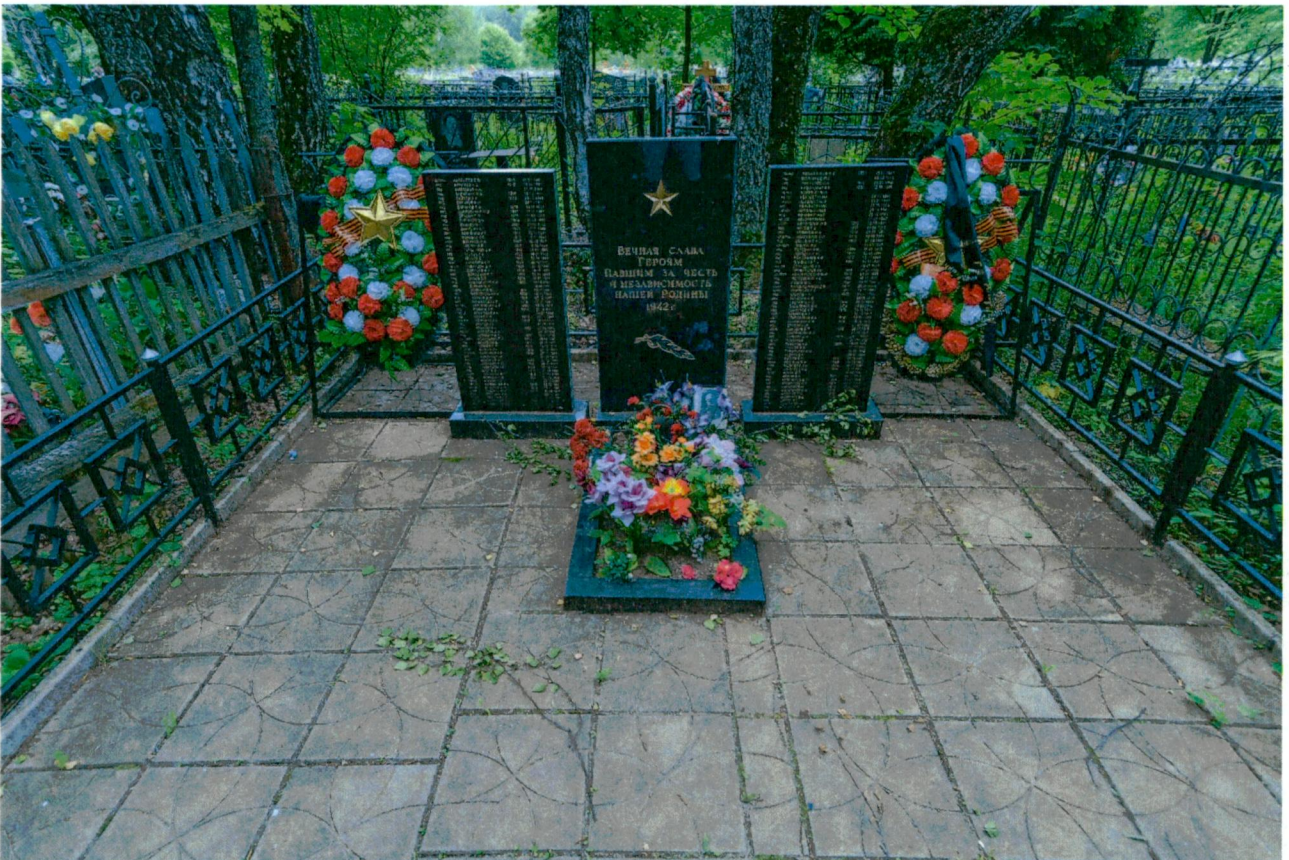
3. Общий вид