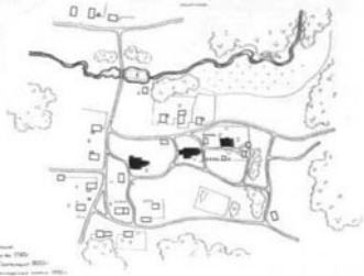
А (оборотная сторона)

Мемориальный комплекс в честь погибших воинов