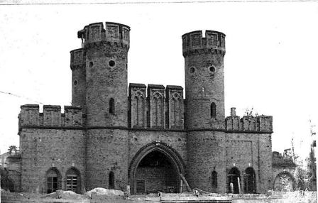
9. Фото [13X (8)], иллюстрирующее генеральный план участка с охранной зоной, план здания и сооружений, все фасады, основные интерьеры и фрагменты.