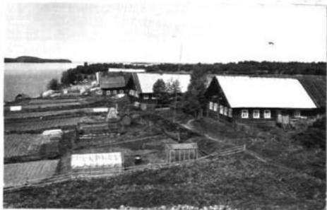
Фото или схематический план