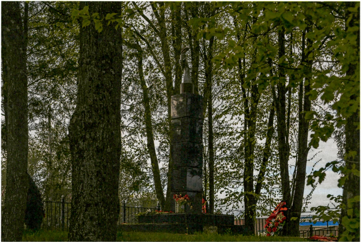
4. Вид с юга