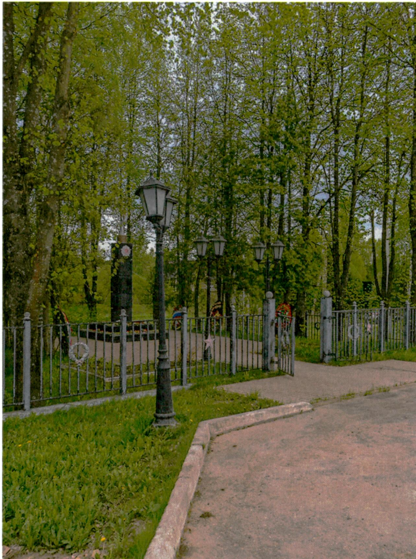
7. Вид с севера