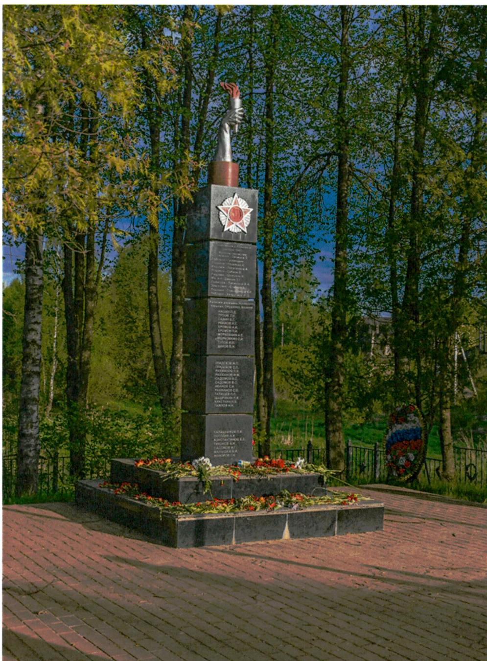
1. Вид на памятник с севера

Фотофиксация объекта культурного наследия регионального значения «Братская могила советских воинов, 1941 г., 1965-1967 гг.»