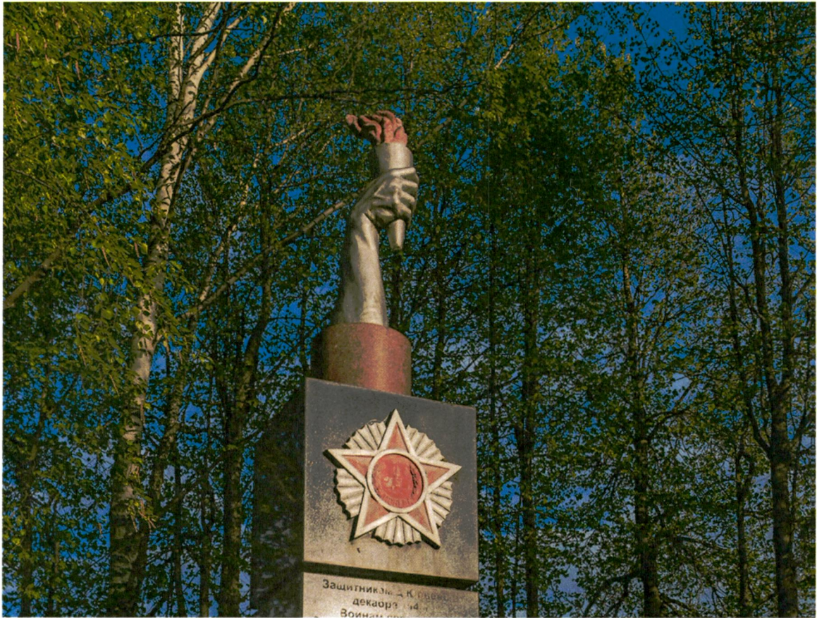
2. Элемент памятного знака. Вид с севера