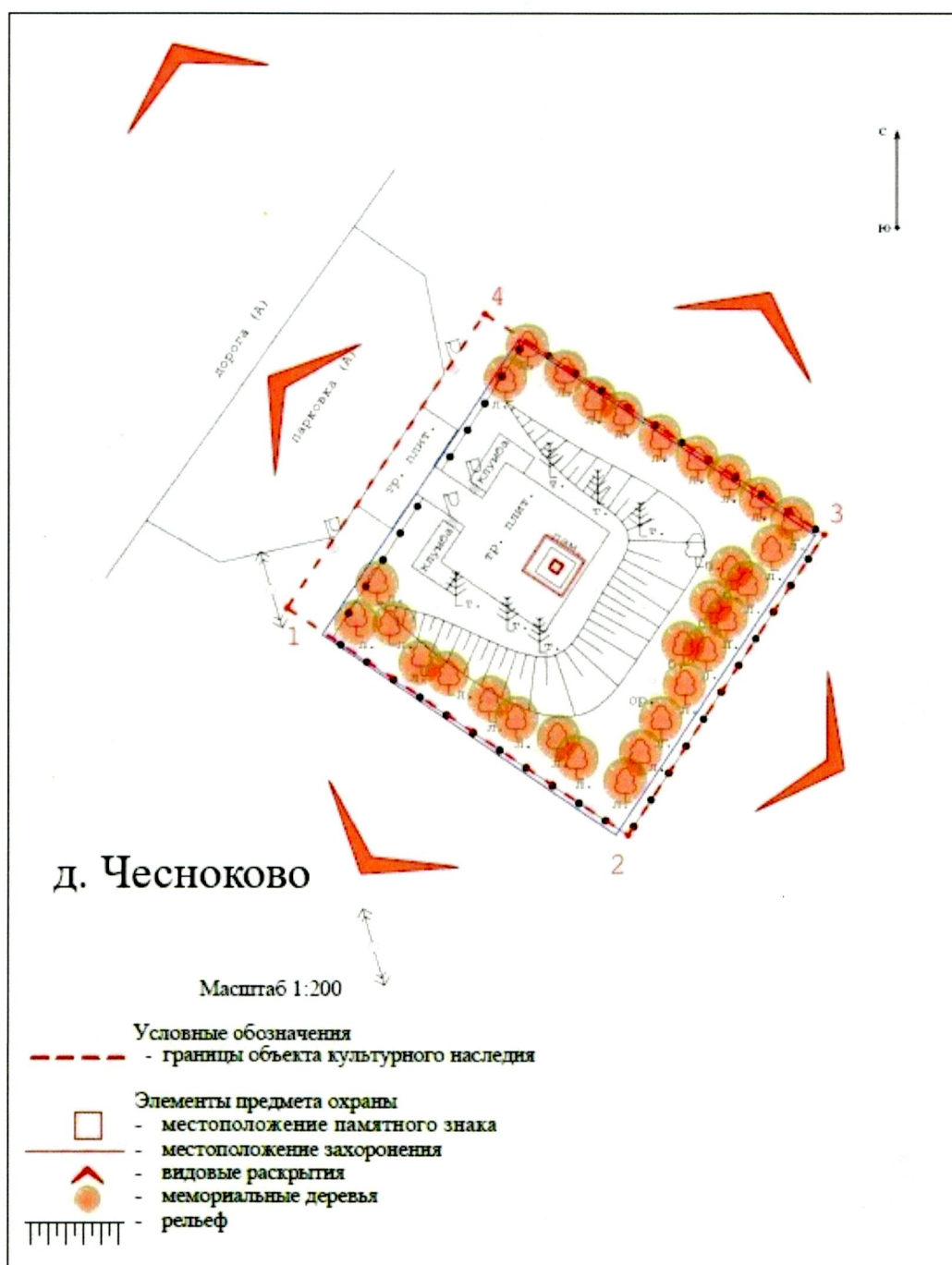
Схема предмета охраны объекта культурного наследия регионального значения «Братская могила советских воинов, 1941 г., 1965-1967 гг.»