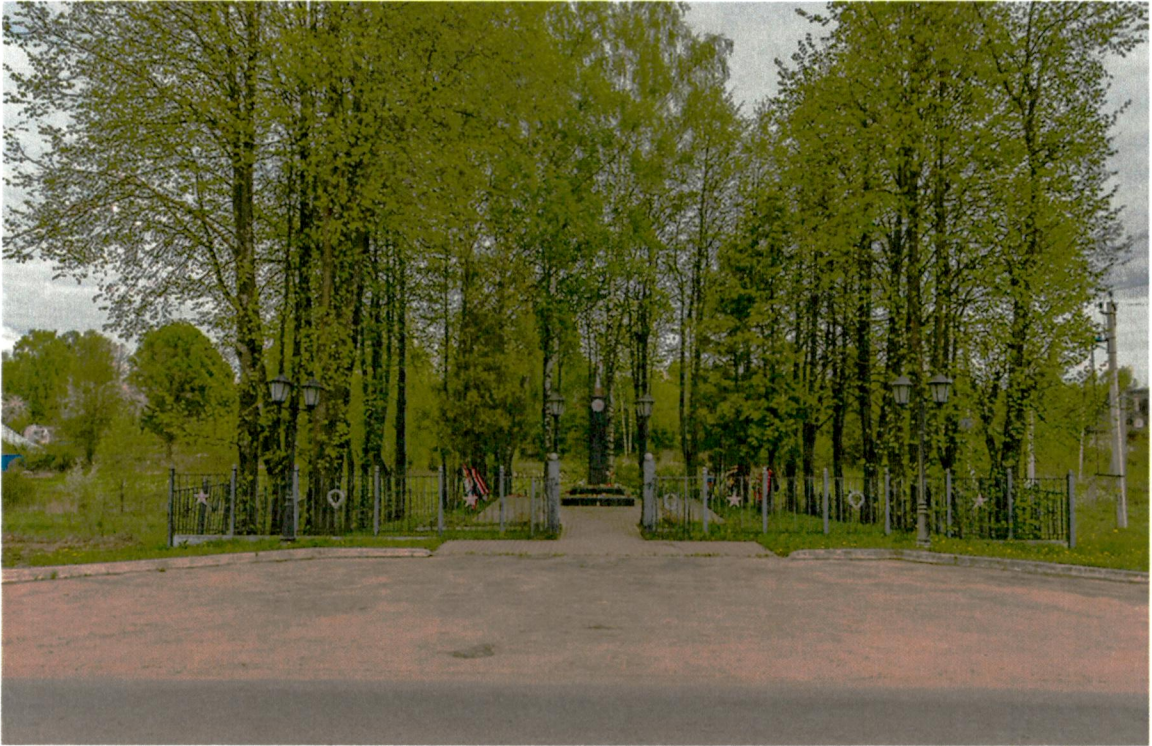
6. Вид на памятник в окружении насаждений с северо-запада