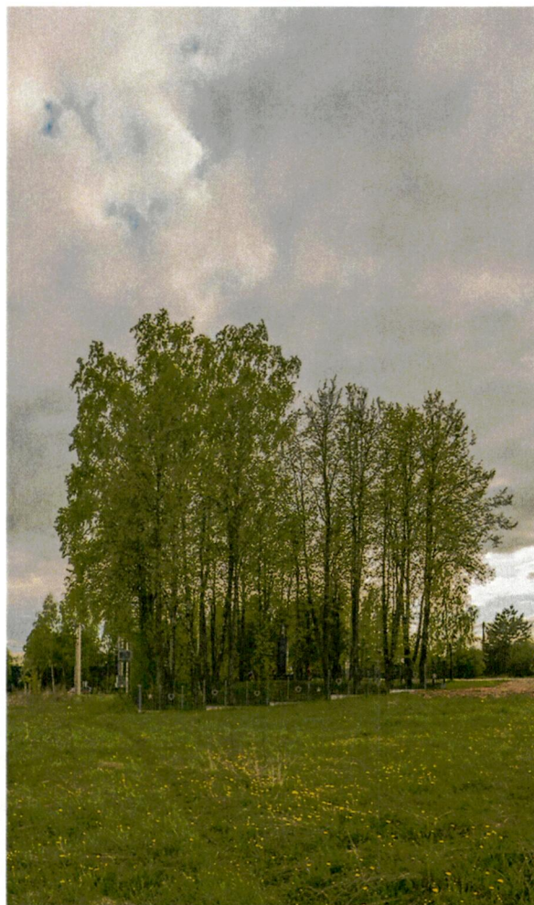
5. Вид на памятник в окружении насаждений с северо-востока