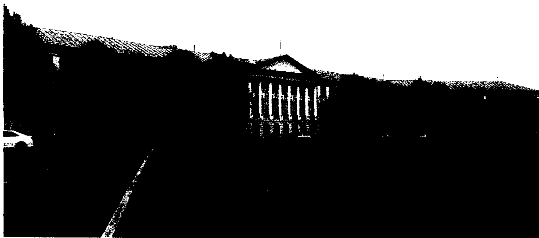
Фото № 2. Г. Ярославль, Советская пл., д. 5. Здание Присутственных мест и Губернского правления, 1780 г. Общий вид с юго-востока. Съемка 17.10.2014 г.

Фотографическое изображение объекта культурного наследия, за исключением отдельных объектов археологического наследия, фотографическое изображение которых вносится на основании решения соответствующего органа охраны объектов культурного наследия