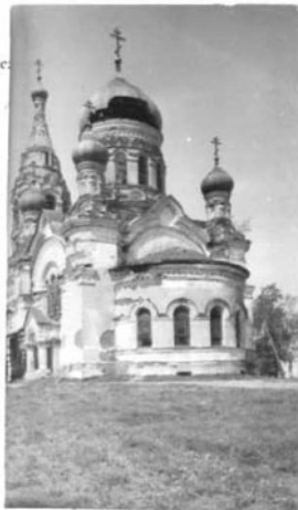
Ц К А (оборотная сторона)