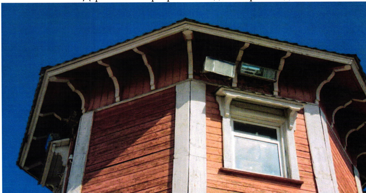
9. Венчающий карниз на деревянных кронштейнах и наличник окна верхнего деревянного яруса.