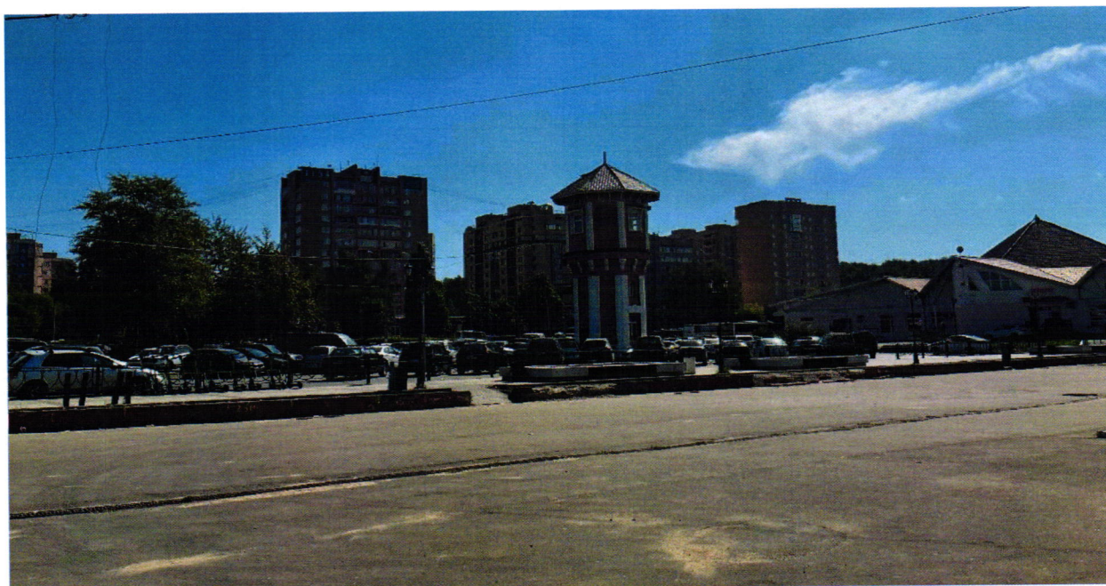
2. Общий вид с северо-запада, от железнодорожного вокзала.