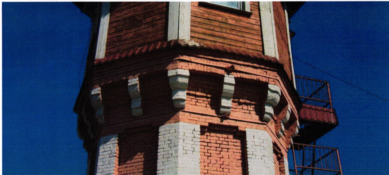
7. Второй деревянный ярус. Дверь с балконом. Чердачное окошко.