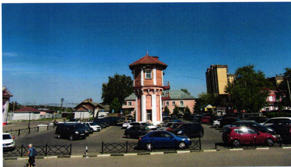
1. Общий вид с юга.

Фотофиксация объекта культурного наследия регионального значения «Водонапорная башня железнодорожной станции Дмитров, 1896-1902 гг.»