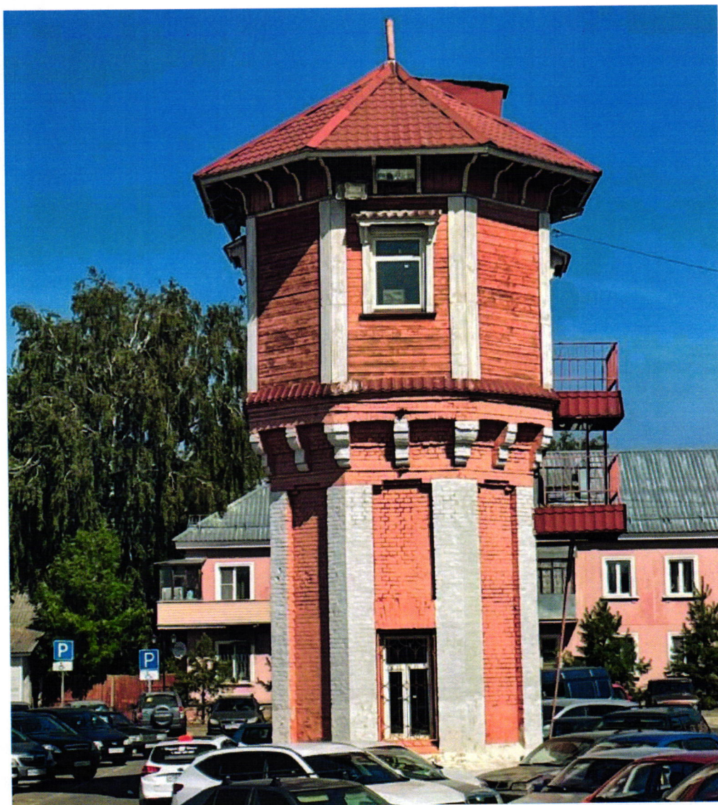
4. Вид с юга. Оконные проемы на южной грани.