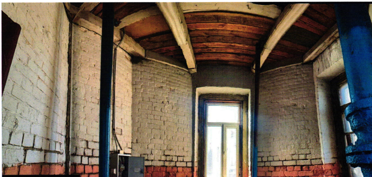
8. Деревянное перекрытие. Вид с северо-запада.