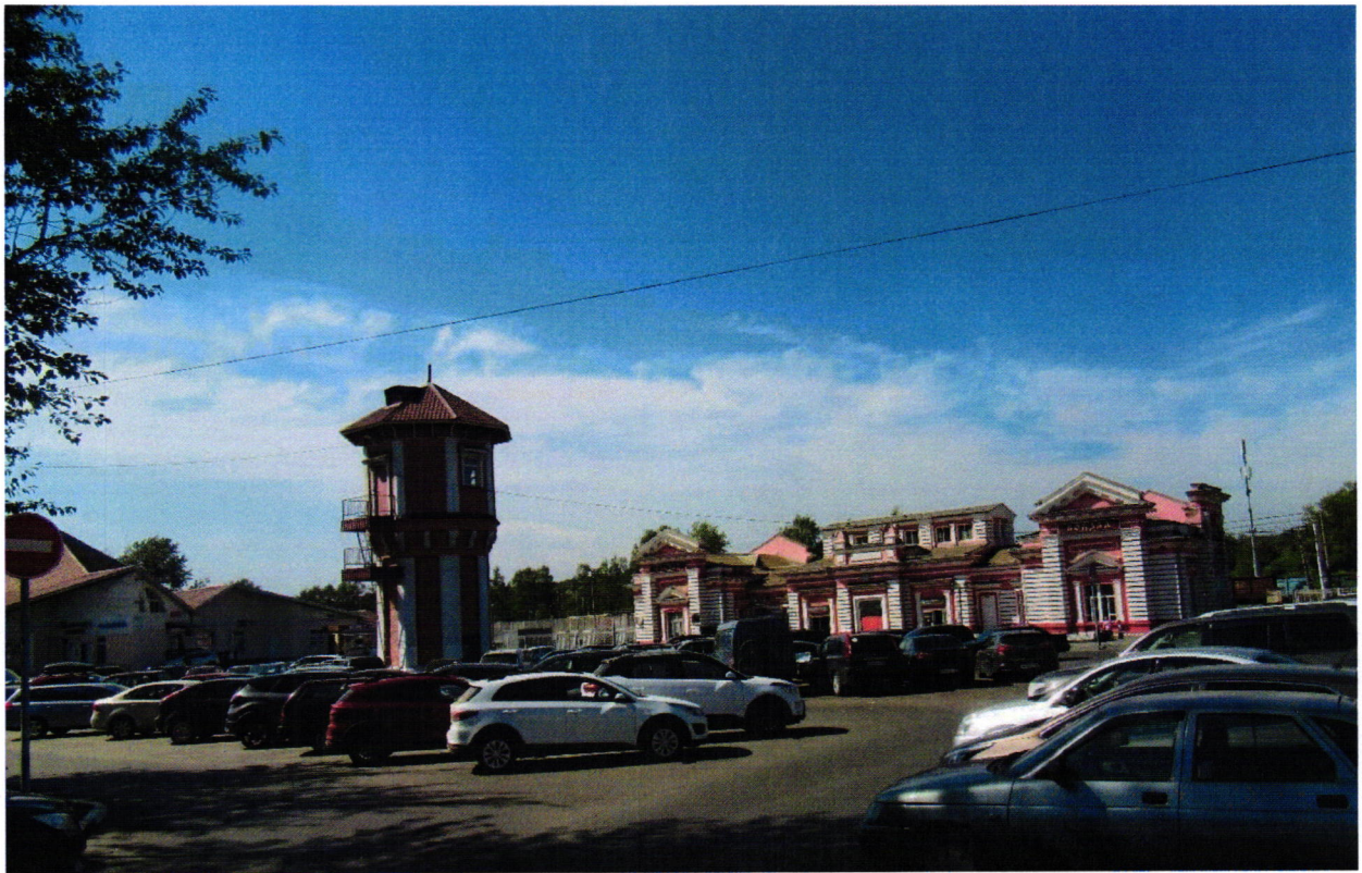
5. Общий вид с северо-востока от Вокзальной улицы.