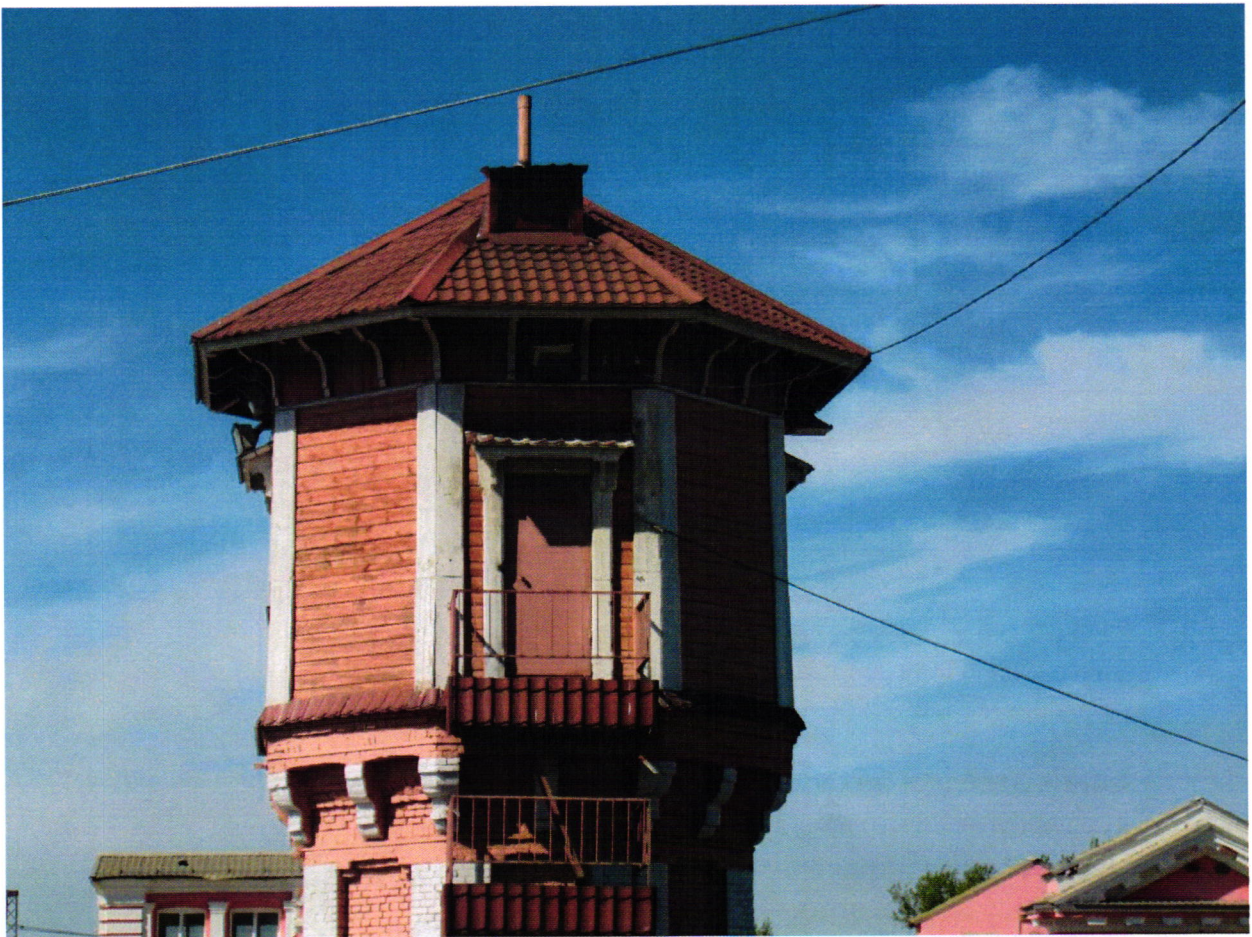
6. Второй деревянный ярус. Дверь с балконом. Чердачное окошко.