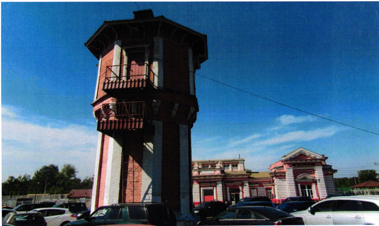
3. Вид с востока. Лестница с балконами на восточной грани.