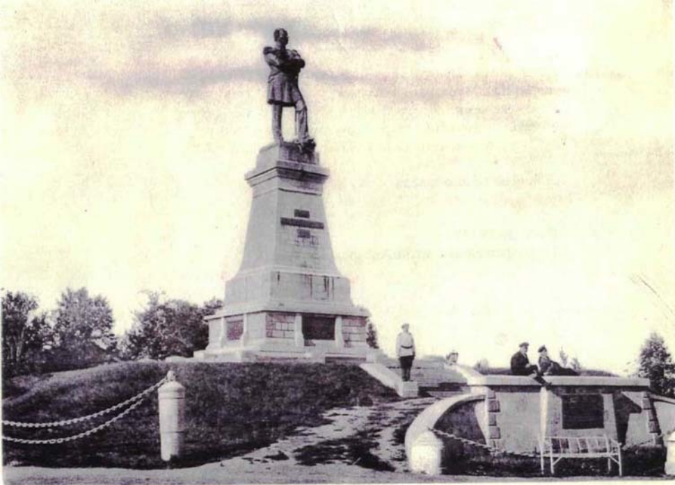
19. Памятникъ гр. Муравьеву-Амурскому.