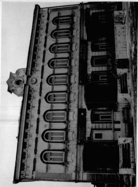
Фото или схематический план