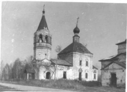
Фото и/или схематический план