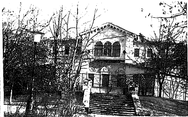
Фото или схематический план