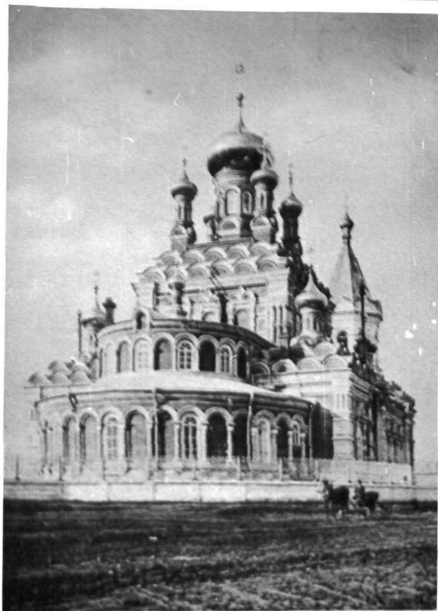
г. Кунгурь, Перм. губ. № 35. Нижняя церковь.