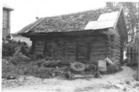
Фото или схематический план