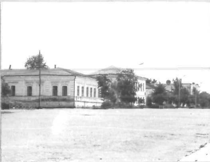
Фото или схематический план