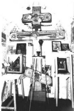
Фото или схематический план