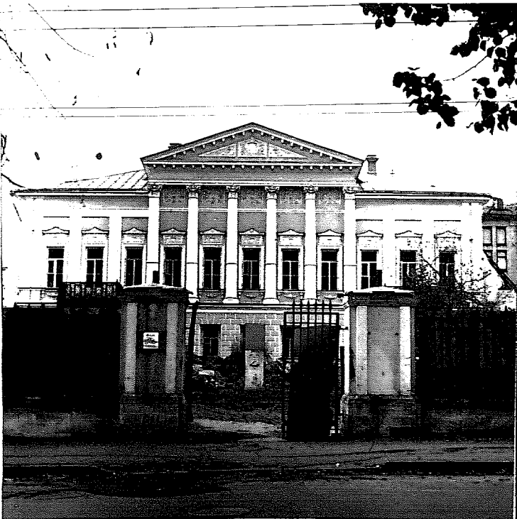
А (оборотная сторона)