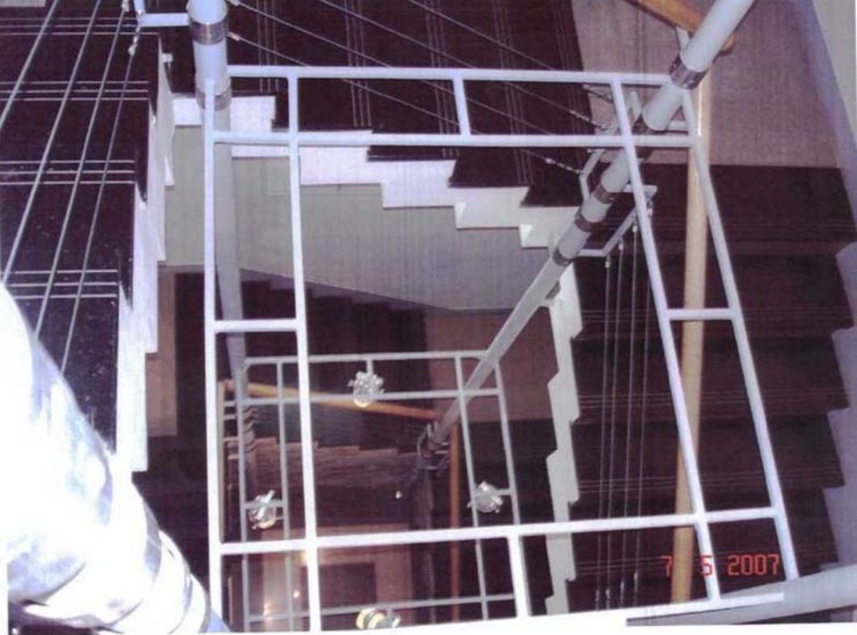
Фото №22 г. Хабаровск, пер. Арсеньева,4. Дом доходный П.А. Грудинского, 1910 г. Фрагмент интерьера, лестница. Фото Л.Б. Шокуровой, 2007 г.