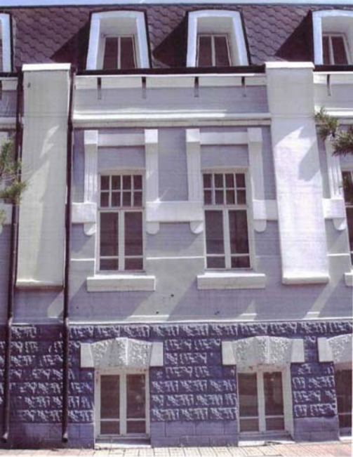
Фото №15 г. Хабаровск, пер. Арсеньева,4. Дом доходный П.А. Грудинского, 1910 г. Фрагмент северо-западного фасада. Фото Л.Б. Шокуровой, 2007 г.