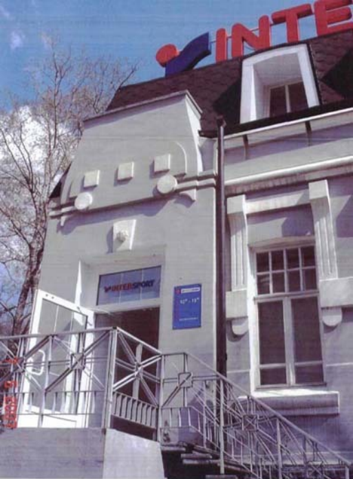
Фото №14 г. Хабаровск, пер. Арсеньева, 4. Дом доходный П.А. Грудвиского, 1910 г. Фрагмент северо-западного фасада. Фото Л.Б. Шокуровой, 2007 г.