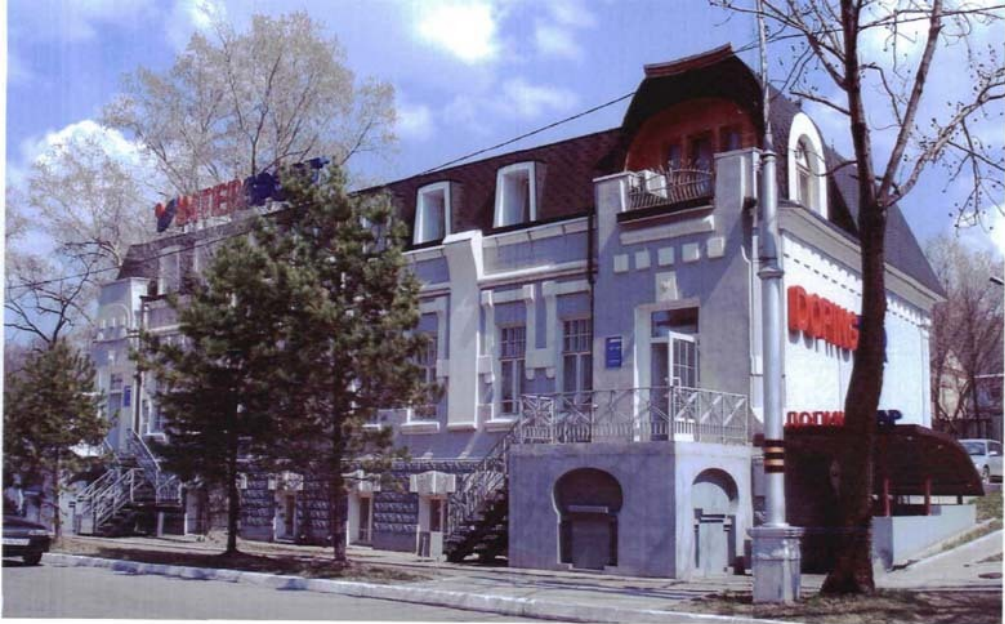
Фото №3 г. Хабаровск, пер. Арсеньева, 4. Дом доходный П.А. Грудинского, 1910 г. Общий вид с запада.