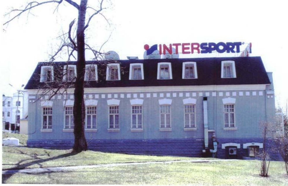
Фото №8 г. Хабаровск, пер. Арсеньева,4. Дом доходный П.А. Грудинского, 1910 г. Северо-восточный фасад.