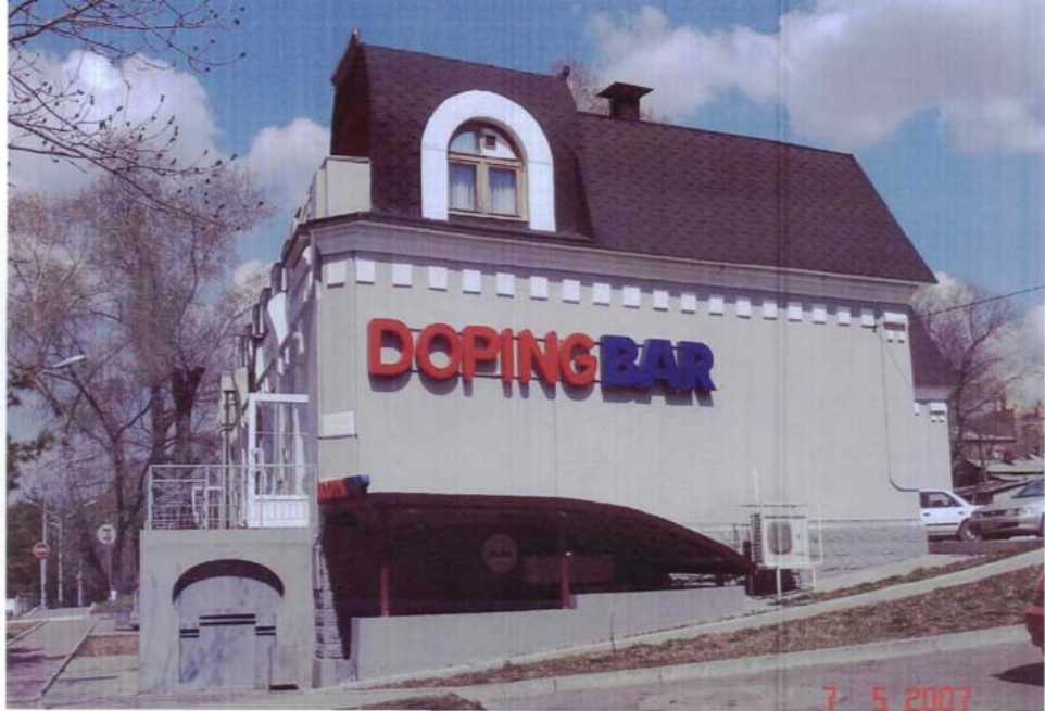
Фото №4 г. Хабаровск, пер. Арсеньева, 4. Дом доходный П.А. Грудинского, 1910 г. Левая часть юго-западного фасада.. Фото Л.Б. Шокуровой, 2007 г.