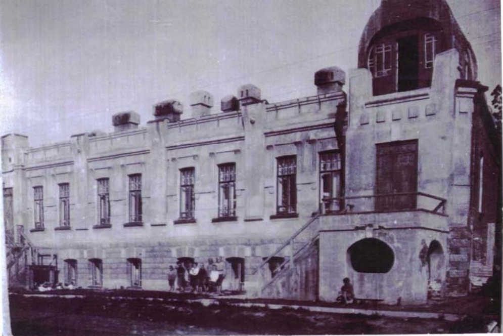
Фото №1 г. Хабаровск, пер. Арсеньева, 4. Дом доходный П.А. Грудинского, 1910 г. Северо-западный фасад.