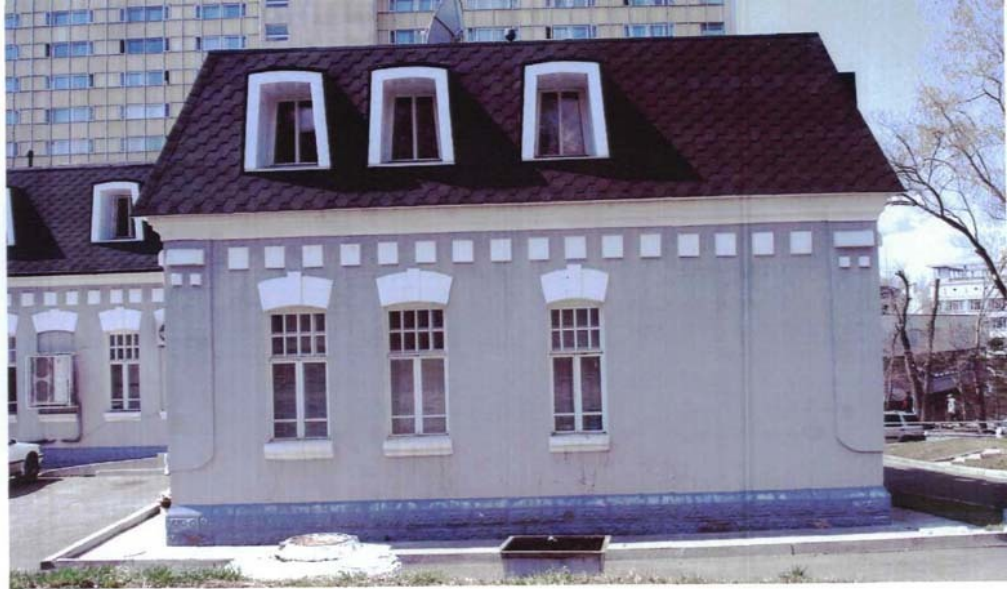
Фото №10 г. Хабаровск, пер. Арсеньева, 4. Дом доходный П.А. Грудинского, 1910 г. Правая часть юго-восточного фасада . Фото Л.Б. Шокуровой, 2007 г.