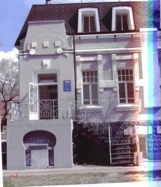
Фото №13 г. Хабаровск, пер. Арсеньева, 4. Дом доходный П.А. Грудинского, 1910 г. Северо-западный фасад. Фото Л.Б. Шокуровой, 2007 г.