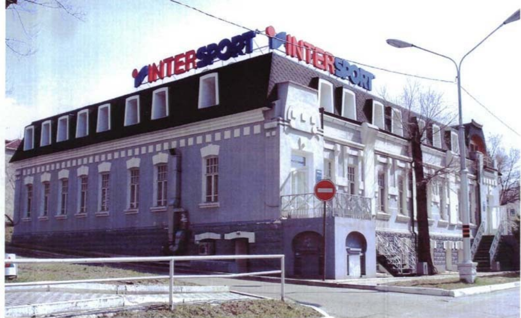
Фото №5 г. Хабаровск, пер. Арсеньева, 4. Дом доходный П.А. Грудинского, 1910 г. Общий вид с севера