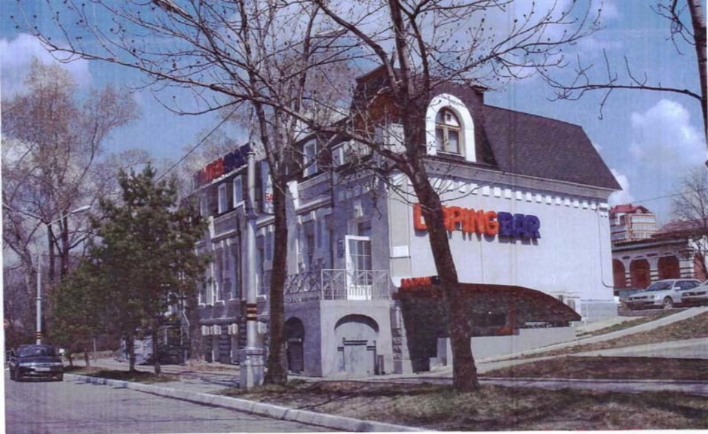
Фото №2 г. Хабаровск, пер. Арсеньева, 4. Дом доходный П.А. Грудинского, 1910 г. Общий вид с запада