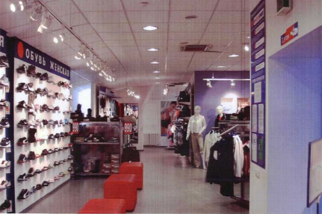
Фото №21 г. Хабаровск, пер. Арсеньева,4. Дом доходный П.А. Грудинского, 1910 г. Фрагмент интерьера, мансарда. Фото Л.Б. Шокуровой, 2007 г.