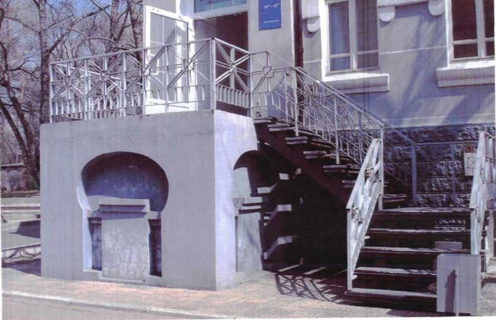
Фото №16 г. Хабаровск, пер. Арсеньева, 4. Дом доходный П.А. Грудинского, 1910 г. Фрагмент северо-западного фасада. Фото Л.Б. Шокуровой, 2007 г.