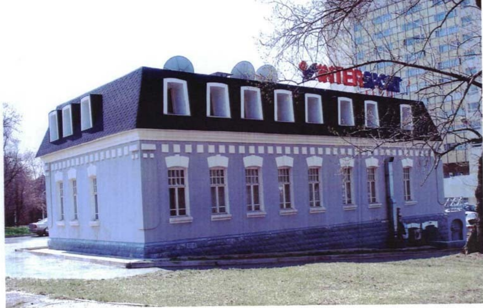
Фото №9 г. Хабаровск, пер. Арсеньева,4. Дом доходный П.А. Грудинского, 1910 г. Общий вид с востока