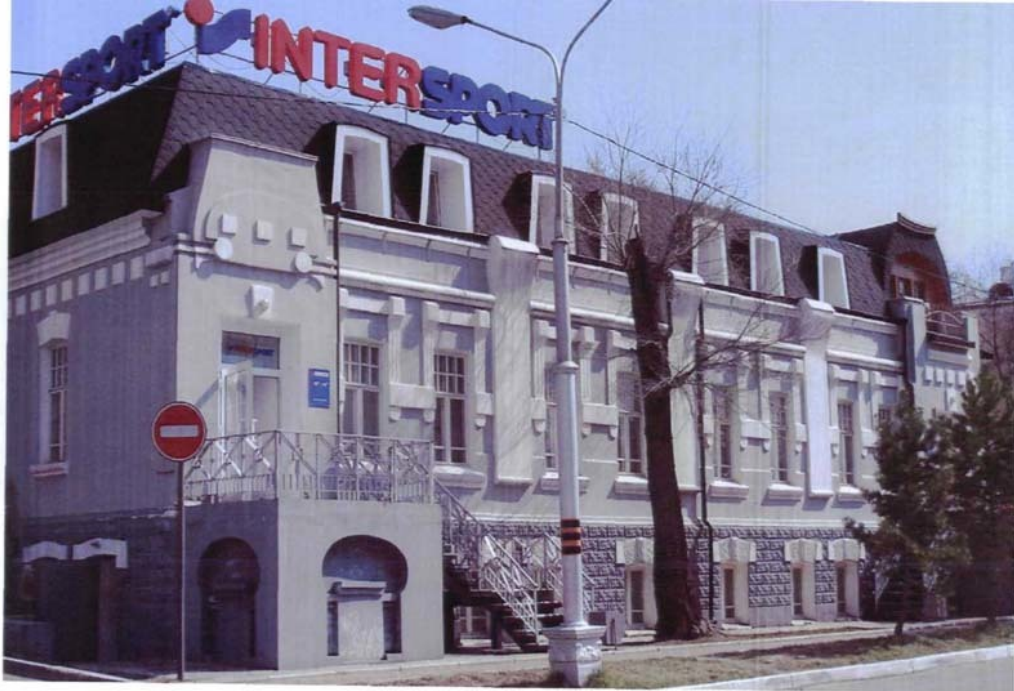
Фото №6 г. Хабаровск, пер. Арсеньева, 4.

Дом доходный П.А. Грудинского, 1910 г. Северо-западный фасад, вид с севера. 2007 г.