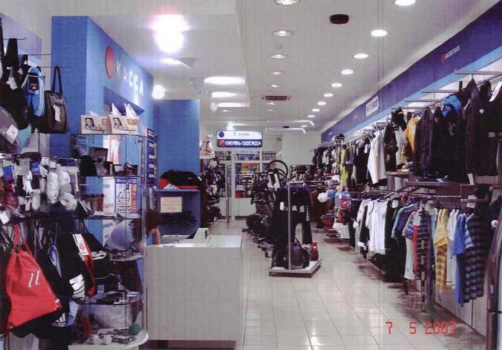
Фото №20 г. Хабаровск, пер. Арсеньева,4. Дом доходный П.А. Грудинского, 1910 г. Фрагмент интерьера, 1-й этаж. Фото Л.Б. Шокуровой, 2007 г.