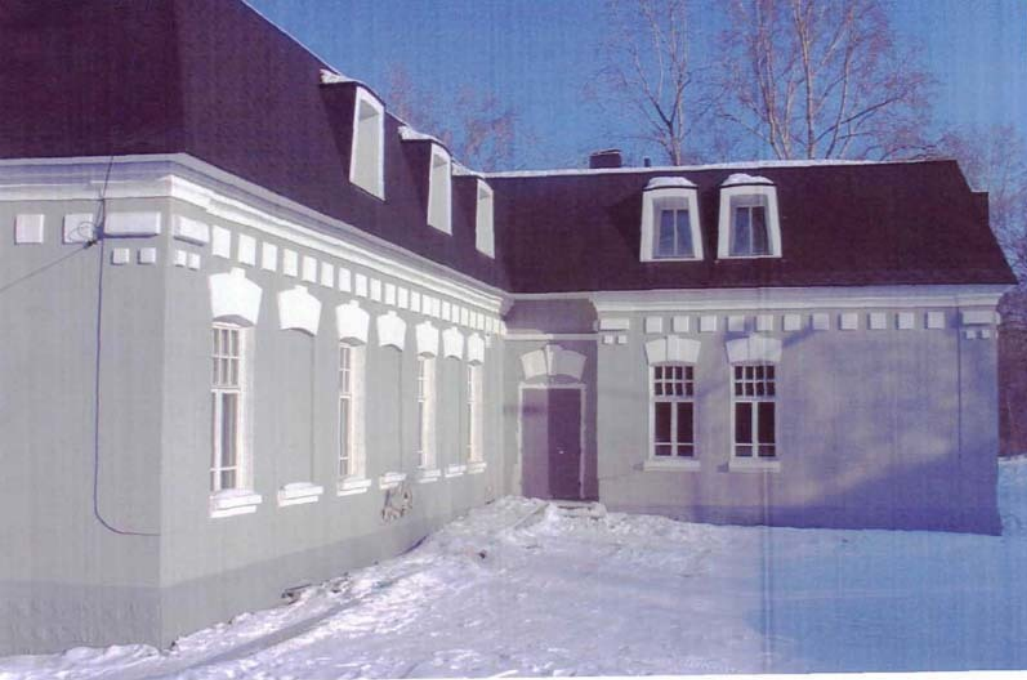
Фото №12 г. Хабаровск, пер. Арсеньева, 4. Дом доходный П.А. Грудинского, 1910 г. Общий вид с юго-запада. Фото Л.Б. Шокуровой, 2005 г.