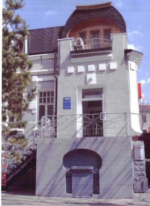
Фото №17 г. Хабаровск, пер. Арсеньева,4. Дом доходный П.А. Грудинского, 1910 г. Фрагмент северо-западного фасада. Фото Л.Б. Шокуровой, 2007 г.