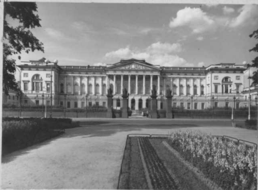
/ Михайловский дворец /Русский музей/.