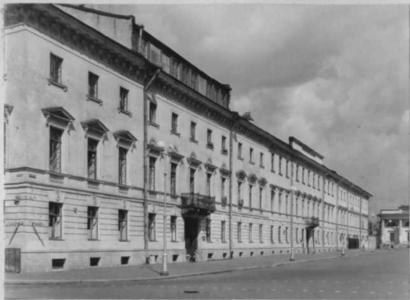
Пл. Искусств, дома 1, 3, 5.