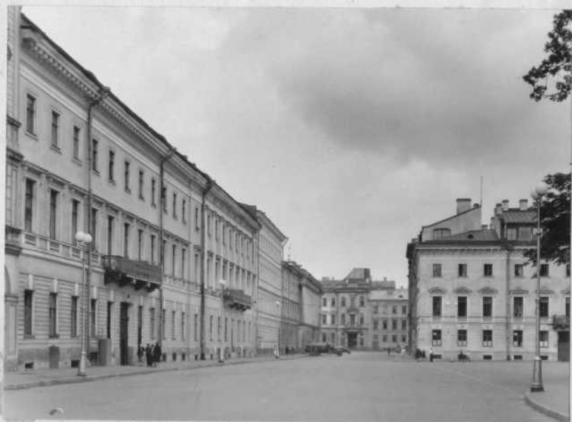
Вид по ул.Ракова в сторону канала Грибоедова.