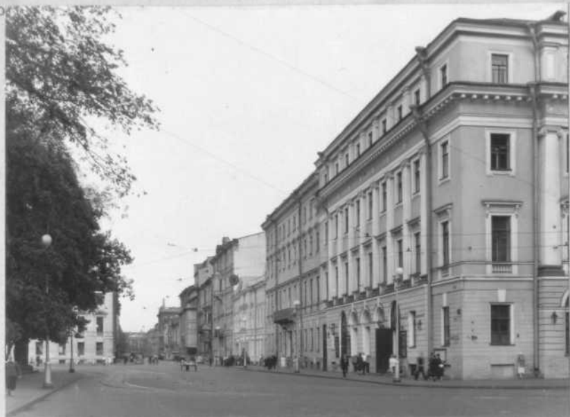
Вид по ул.Ракова в сторону Садовой улицы.