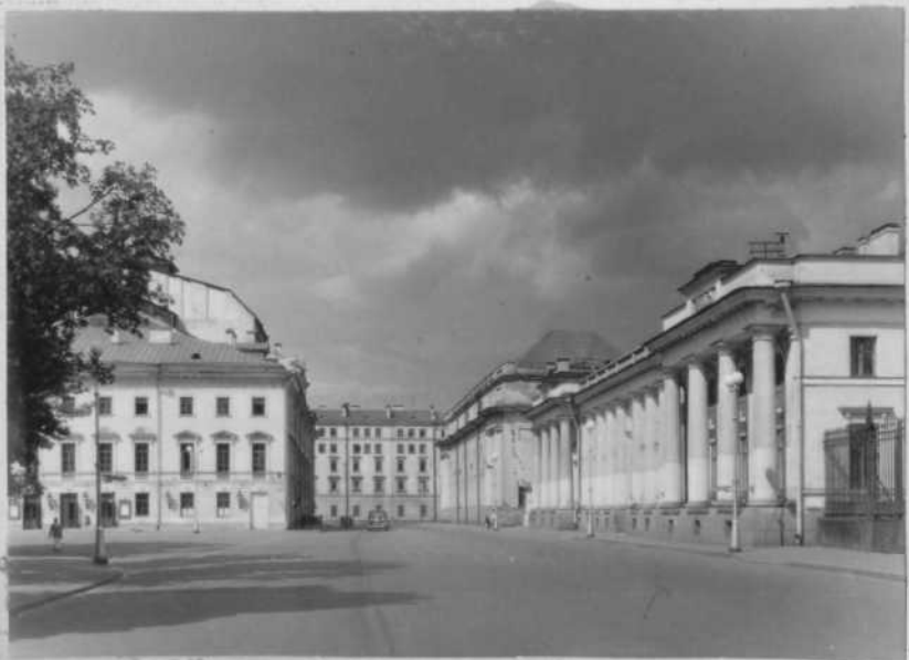
Вид по Инженерной улице в