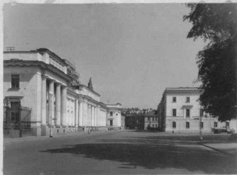
Вид по Инженерной улице в сторону Садовой улицы.