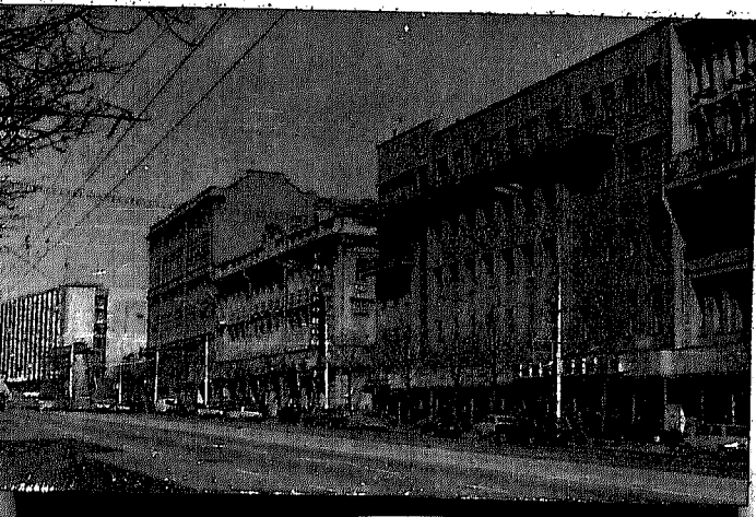
Фото К. Г. Галовкина, 1974г.