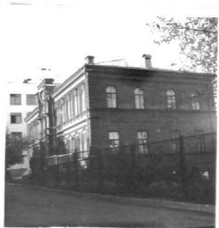
Фото или схематический план