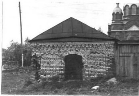
г. Мелитоза Улицы Советская, № 10 Кирпич / см III-м. ПЛАН