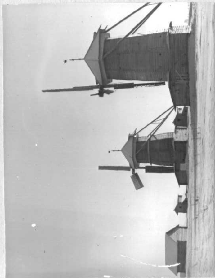
Фото или схематический план