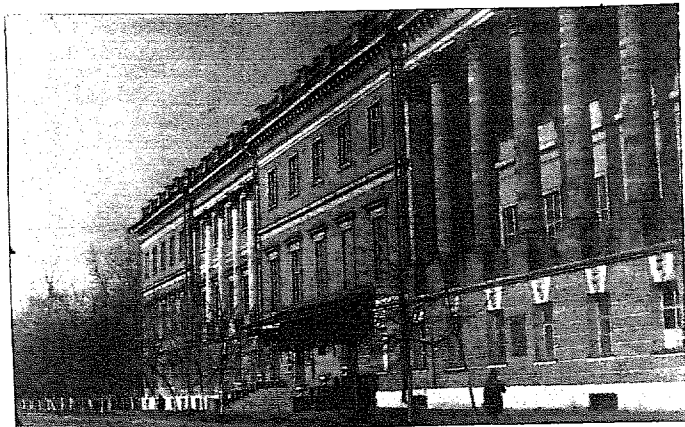
Фото 1942 г. с мемориальной доской в здании Палаты