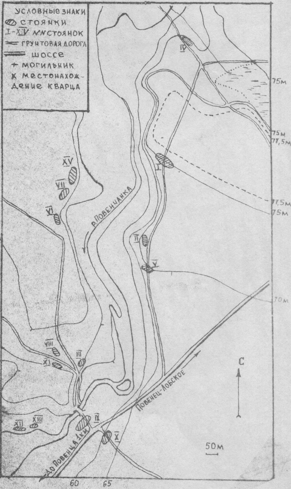
Схема расположения стоянок в долине у р. Повенчанки