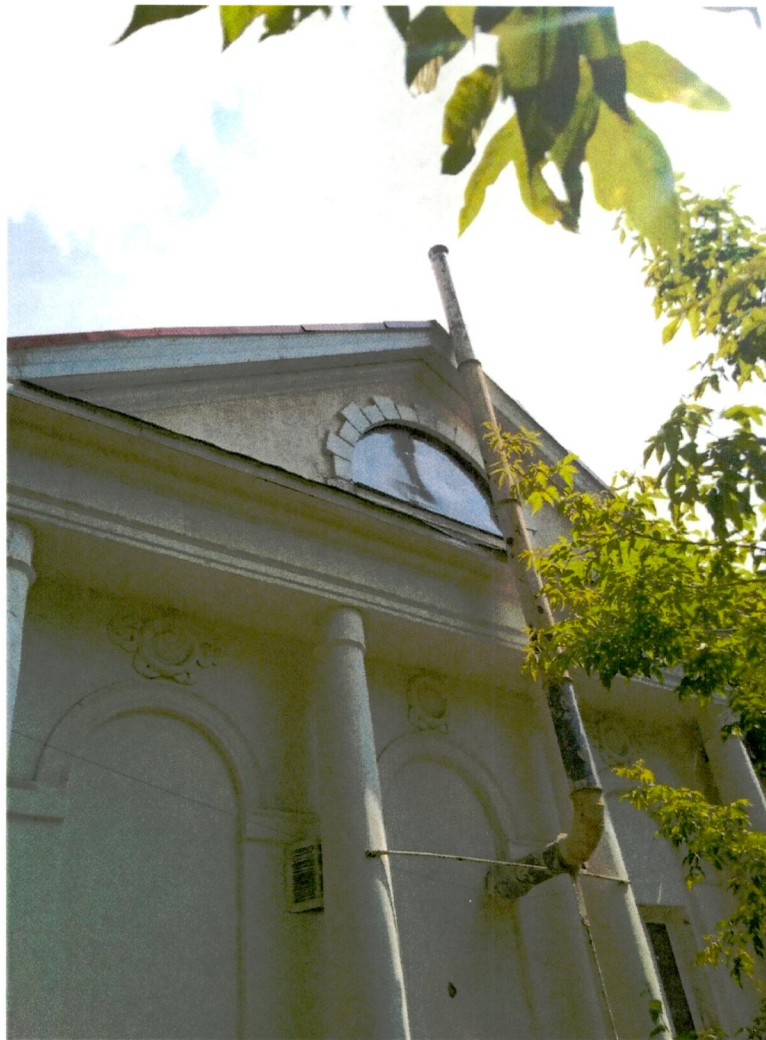
4. Центральная часть юго-западного фасада