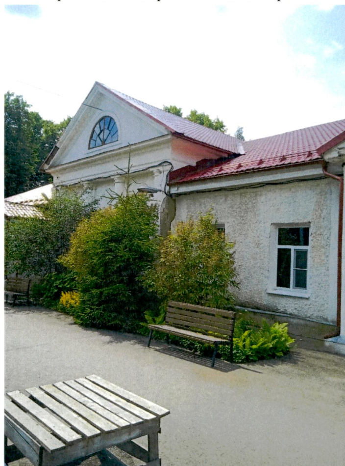
3. Фрагмент северо-восточного фасада, центральная часть