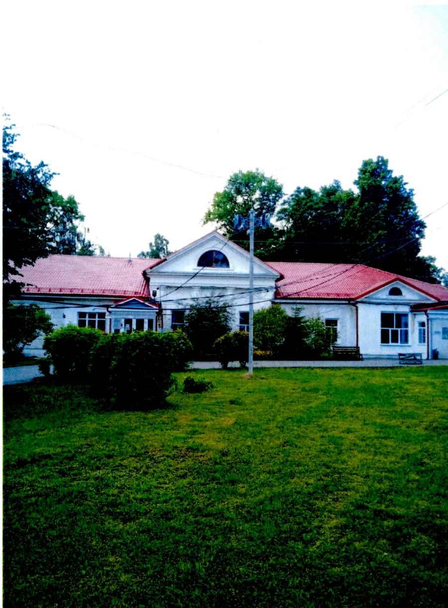
1. Северо-восточный фасад

Фотофиксация объекта культурного наследия регионального значения «Усадьба Ф.Ф. Берга, арх. И.И. Нивинский, нач. XX в.»