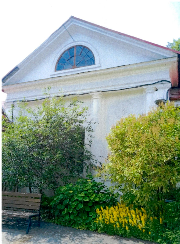
2. Фрагмент северо-восточного фасада