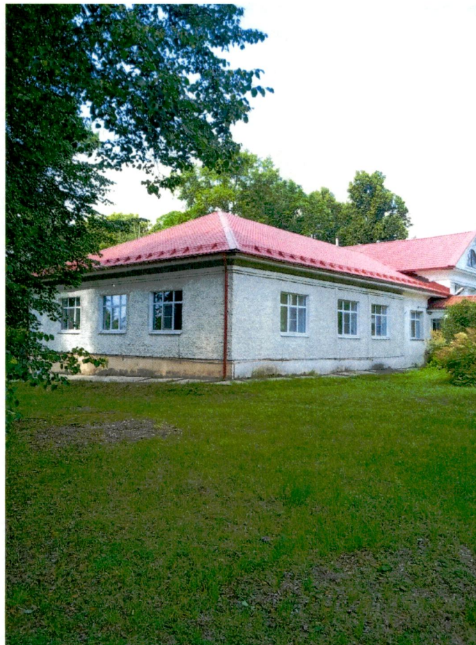
5. Вид с востока