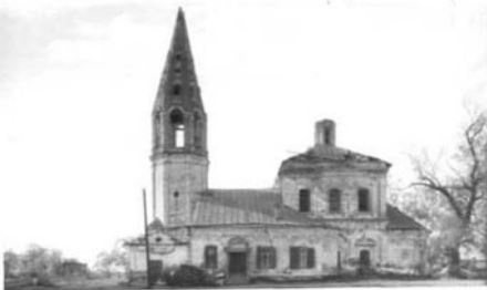
КА (оборотная сторона)