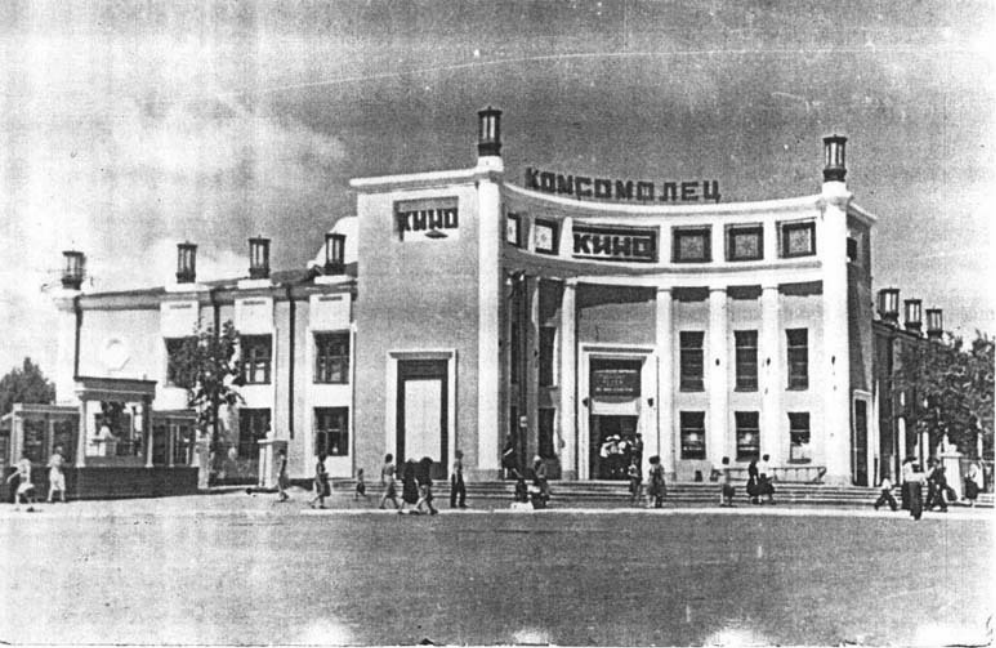
Хабаровский край, г. Комсомольск-на-Амуре, ул. Кирова, 27 Кинотеатр «Комсомолец», 1939-1947 гг.