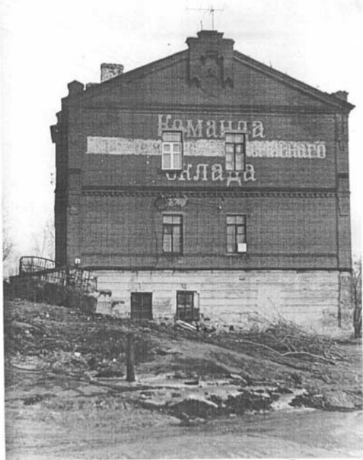
① г. Хайрөвөк, ул Коммунальскай, 3 Комплексе зданий артиллерийского склада. 1873 - 1918 гг. Казарма. 1909 г. Общий вид с запада