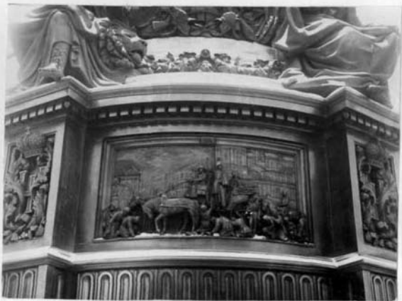
Барельеф "Усмирение Николаем I холерного бунта на Сенной' пл. в 1831г."