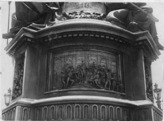
Барельеф "Вступление Николая I на престол."