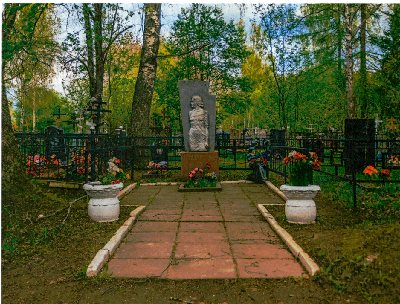
1. Главный вид с юго-запада

Фотофиксация объекта культурного наследия регионального значения «Мои́ла Е.А. Травниковой и И.А. Лаврова, расстрелянных немецко-фашистскими захватчиками в 1941 г.»