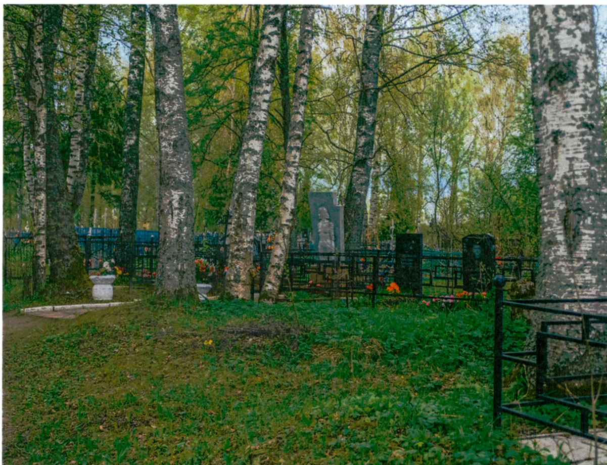
5. Вид с юга на территорию захоронения