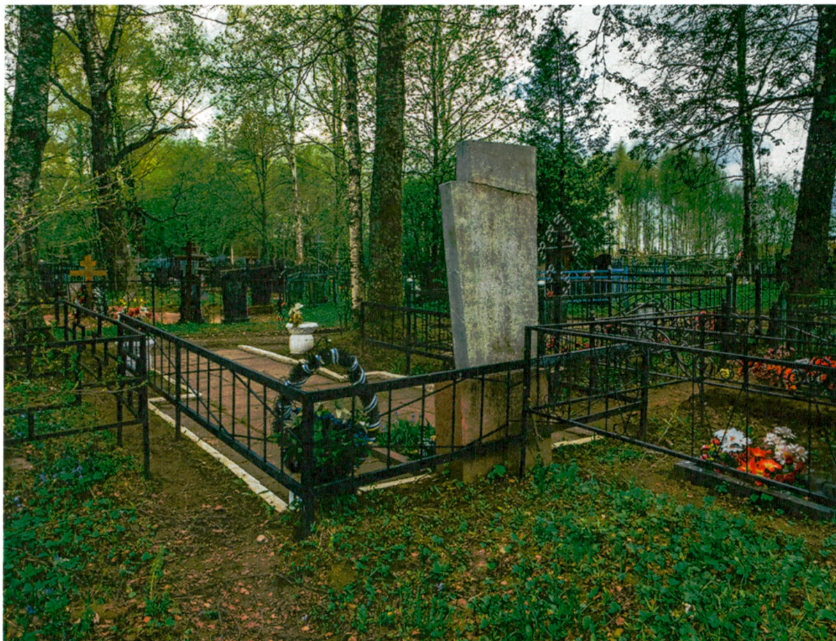
4. Вид с востока на территорию захоронения