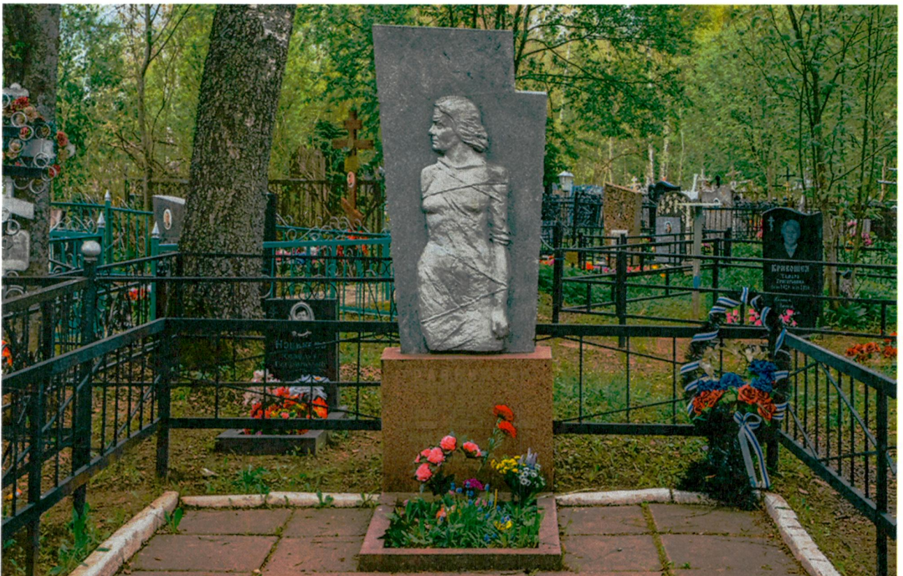
3. Вид с юго-запада на памятник Е.А. Травниковой