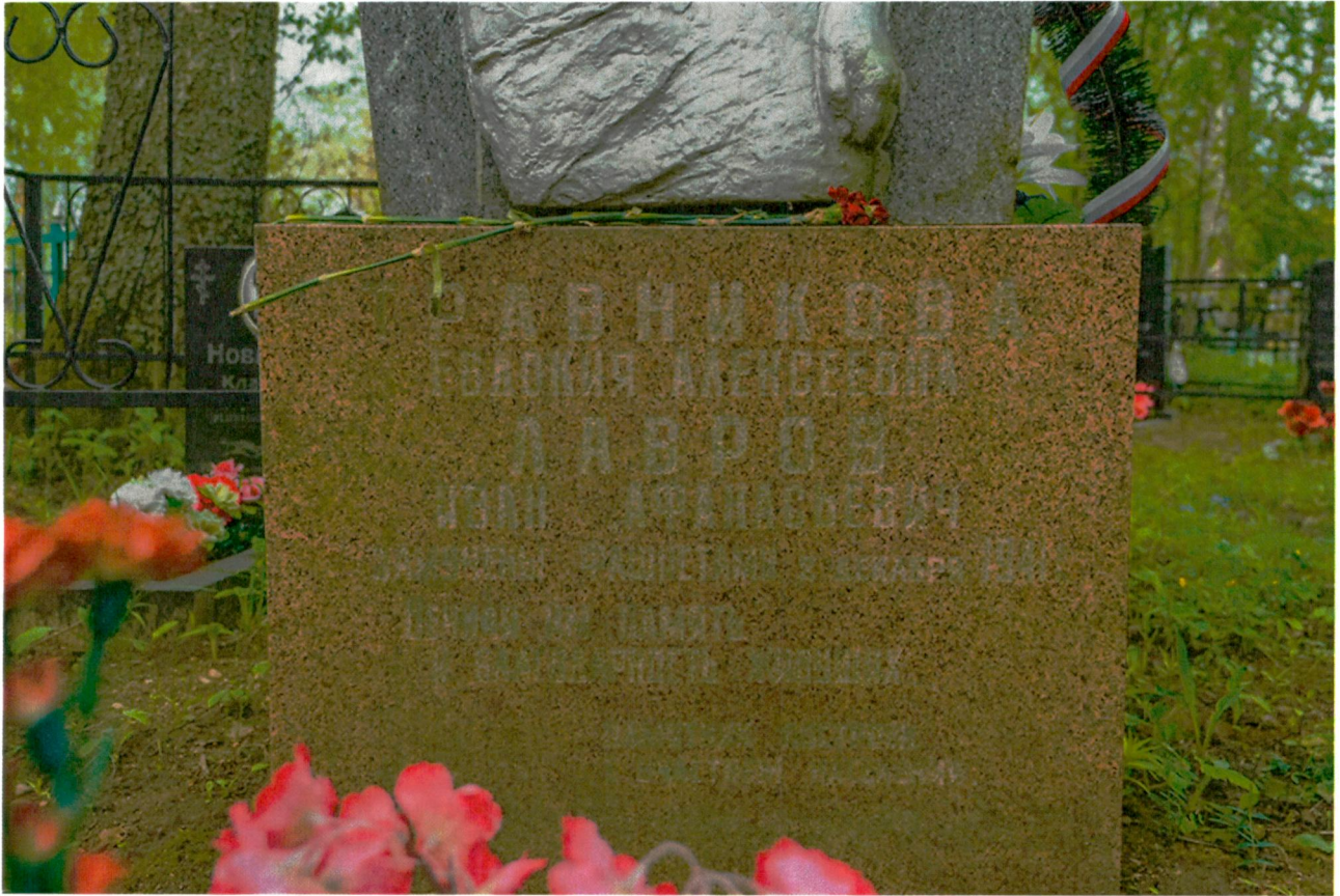
2. Гранитное основание памятника