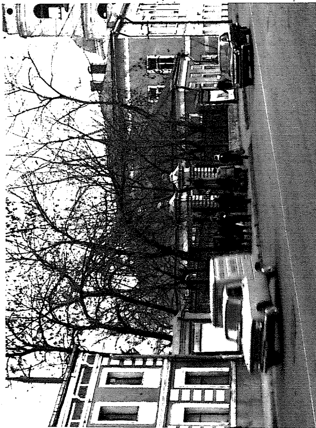
Фото для схематического плана