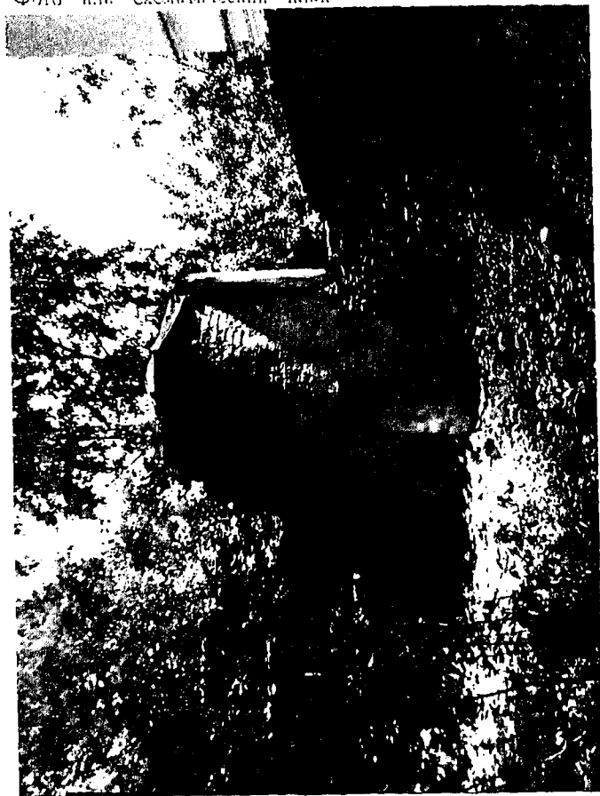
Фото или схематический план