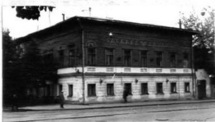
КАРТОЧКА (оборотная сторона)