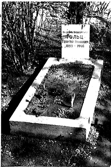
Фото 3.10.1946 г.