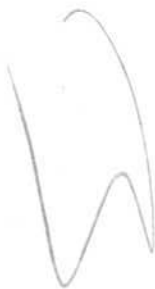
Фото Гельфера С.В., 1989 г.

19. Вологодская обл., Нюксенский р-н, Брусенский с/с, с. Брусенец. Храмовый комплекс. Церковь Рождества Христова, 1790-1805 гг. Цоколь алтаря.