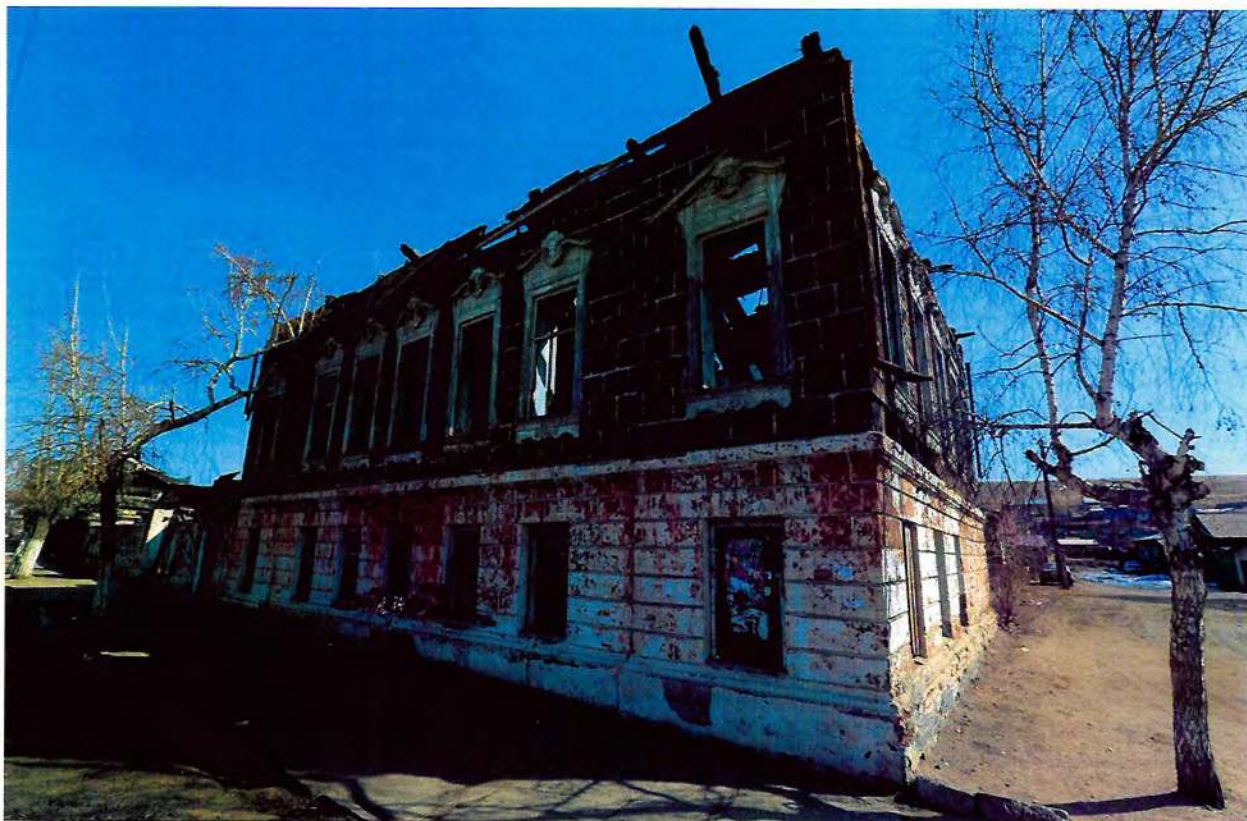
Фото 1. Общий вид с юга.