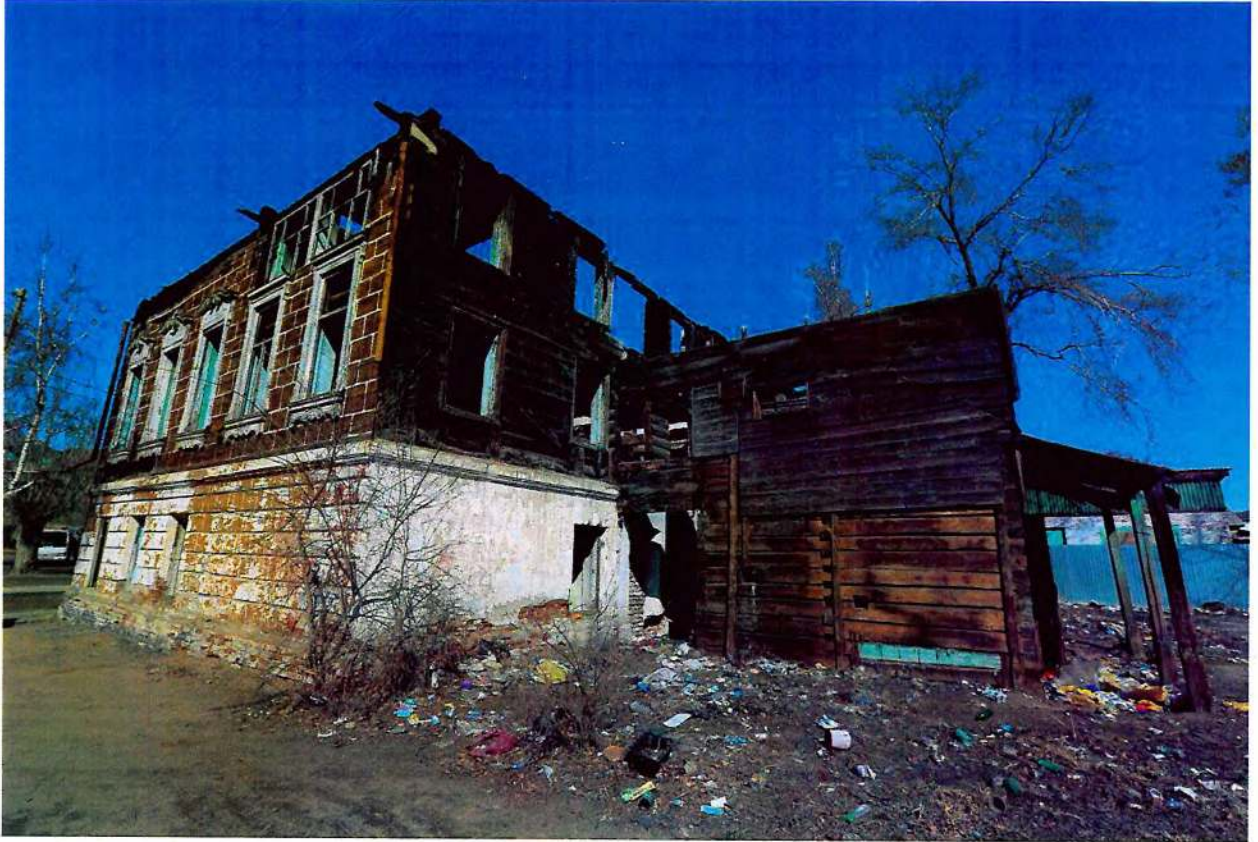
Фото 3. Общий вид с востока.