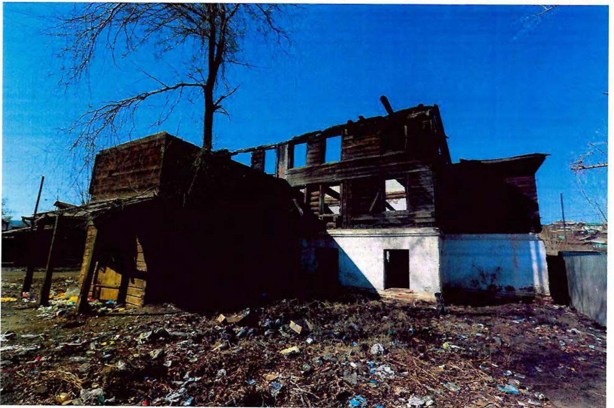
Фото 4. Дворовый северо-восточный фасад.