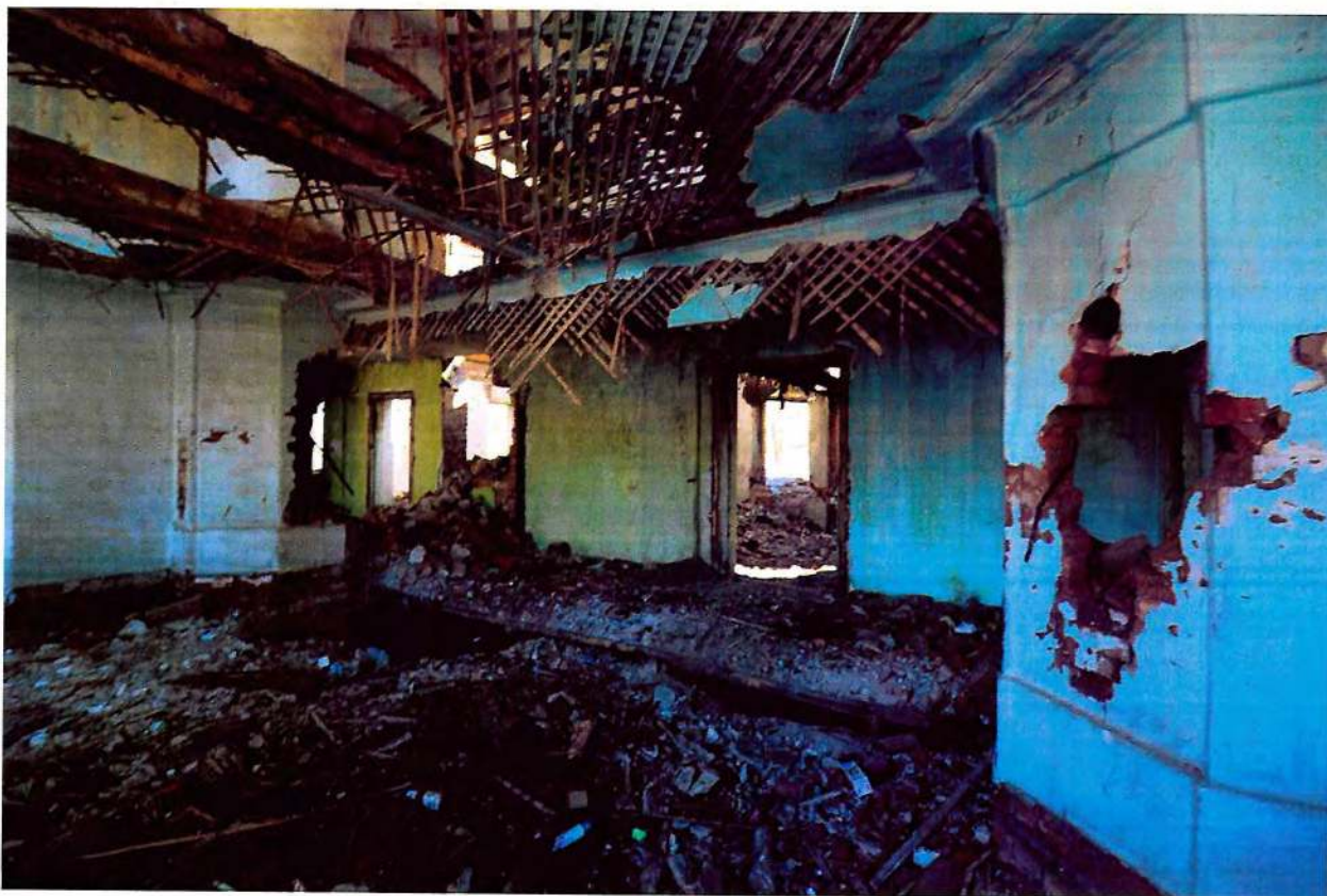
Фото 8. Внутренние помещения.