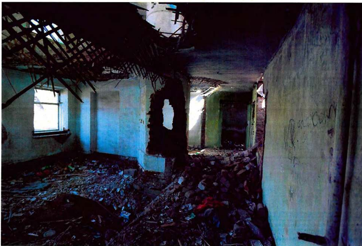
Фото 7. Внутренние помещения.