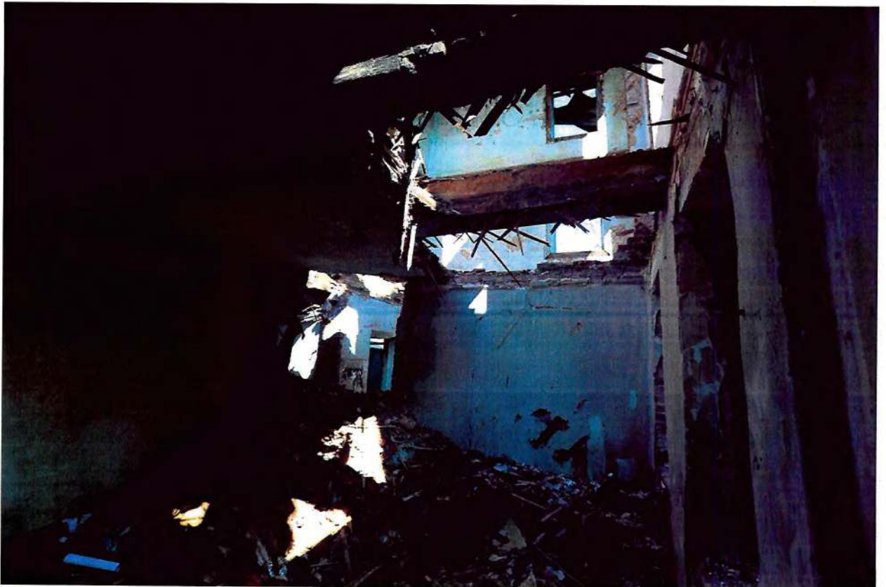
Фото 6. Внутренние помещения.