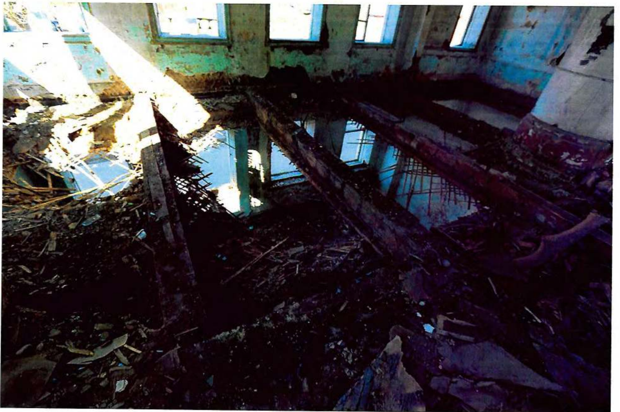
Фото 10. Внутренние помещения.