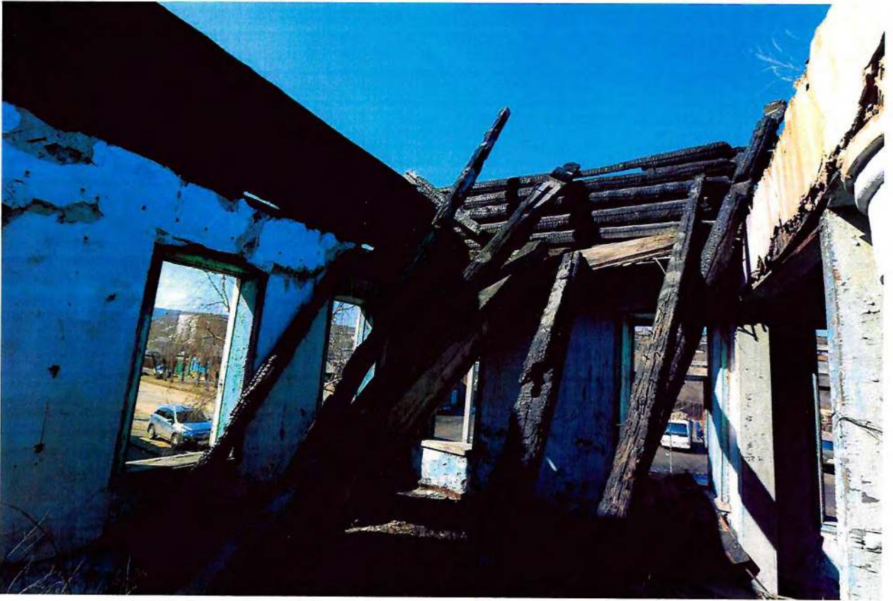
Фото 9. Внутренние помещения.