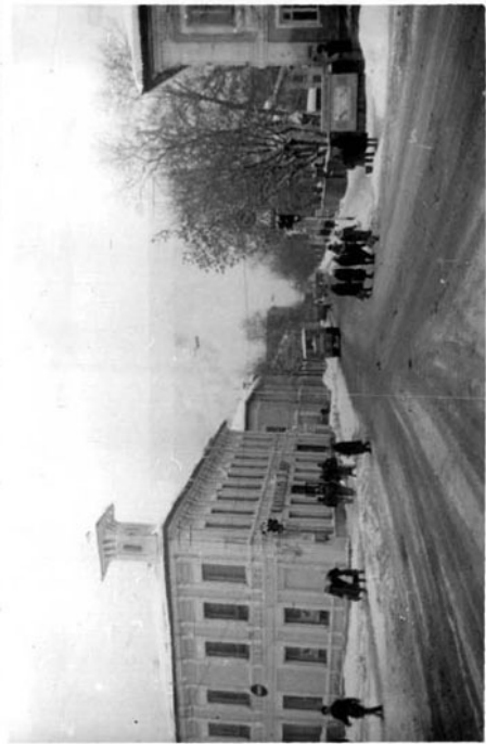
ТОЧКА (оборотная сторона)

Краткое описание 2-ая Ул. Комсомольская /8. Песочная и Песочная ул./ – одна из основных в историческом центре г. Кинешма. Ее застройка складывалась с XIII в., когда она входила в Посад, окружавший городскую крепость. Здесь селились семьи низких сословий: небогатые купцы, ремесленники, крестьяне и солдаты. Несколько деревянных и долукаменных домов сохранилось с I-ой пол. XIX в. В их обшивке сохранились кованые гвозди, а в интерьерах – изразцы того времени. К середине XIX в. построены первые общественные здания /напр. богадельня и приют – д. № 30/. В конце XIX-нач. XX в. в центре города воздвигались белые купеческих двухэтажные дома со складами, лавками и подворьями, постройками. Самое старое здание – жилой дом Потехина № 2/12, затем № 30, № 21/20, № 3, 9, 11, 13, 29. На протяжении улицы нет построек позднего времени за исключением швейной фабрики /д. № 19/. Характерный пример застройки волжского города 2-ой пол. XIX-XX в. Уникальна по сохранности исторической среды.