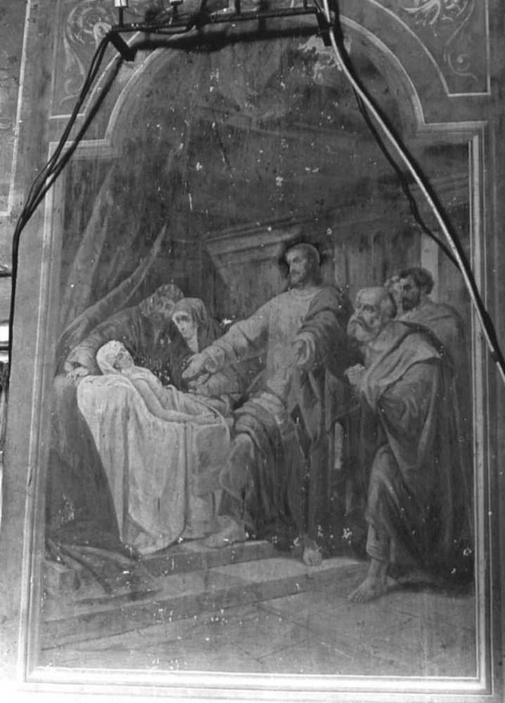
«Resurrezione sopra la porta»