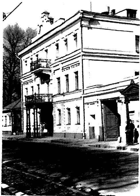
Фото Головкина, май 1941.