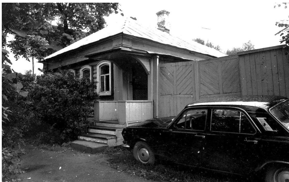
Почтовая ул., 26. Дом Пантелеевых, 1859 г.