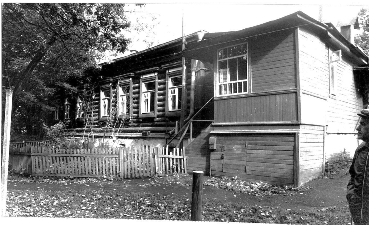
Почтовая ул., 15. Ус. Карпова, вторая половина XIX в. Западный корпус.