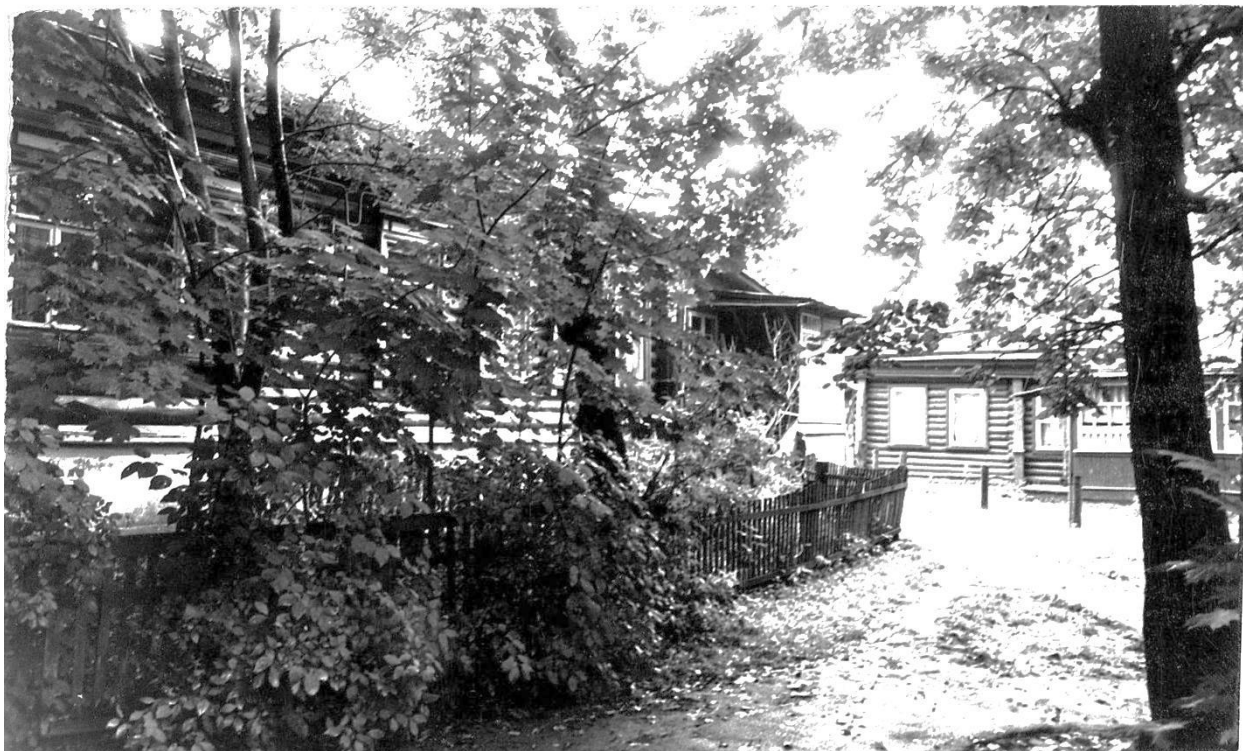
Почтовая ул., 15 – 17. Ус. Карпова, вторая половина XIX в.

Московская область, г. Звенигород. Комплекс застройки ул. Таракановской, середина XIX - начало XX вв. Фото С.А. Никольского, 1987 г.