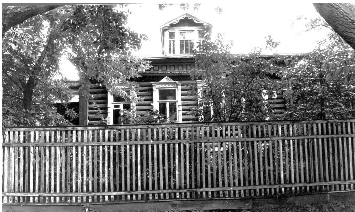
Почтовая ул., 21. Усадьба городская, конец XIX в.