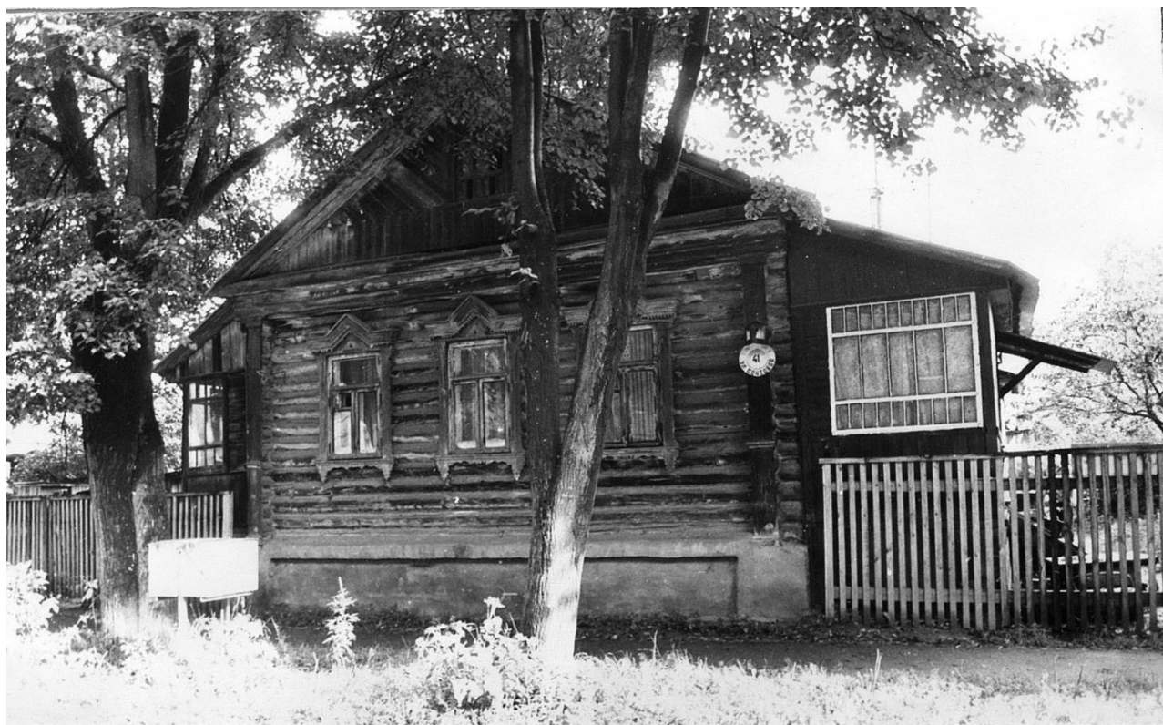
Почтовая, 41. Дом жилой, конец XIX в.