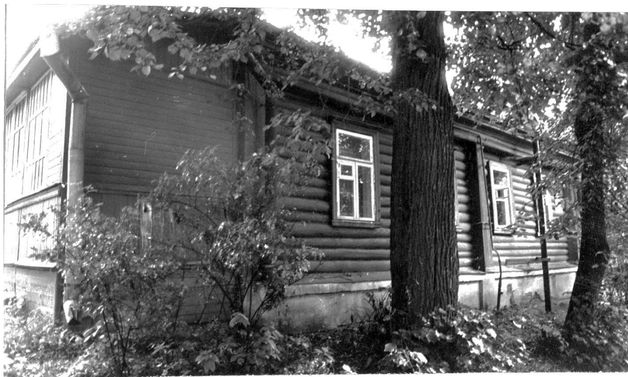
Почтовая ул., 15. Ус. Карпова, вторая половина XIX в. Западный корпус.