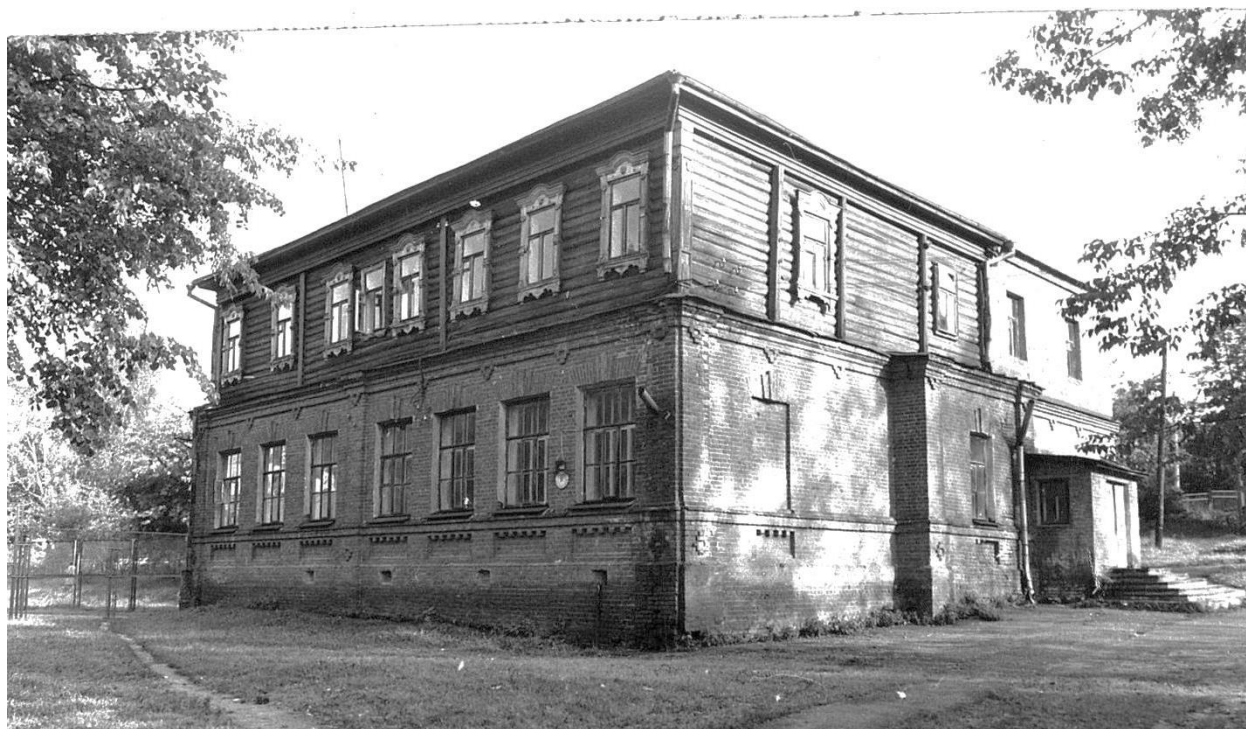
Почтовая ул., 51. Гимназия (?), конец XIX в.

Московская область, г. Звенигород. Комплекс застройки ул. Таракановской, середина XIX - начало XX вв. Фото С.А. Никольского, 1987 г.