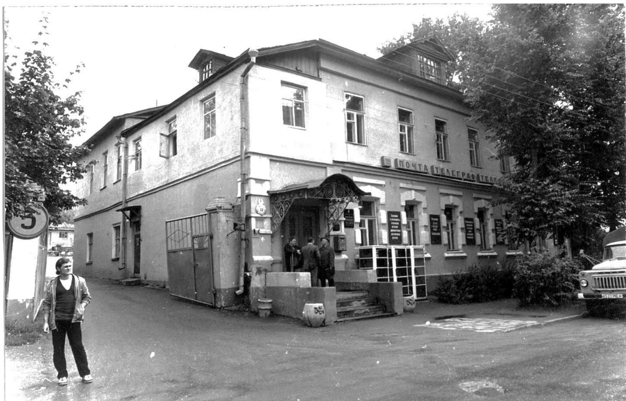
Почтовая ул., 23. Дом жилой, 1907 г.