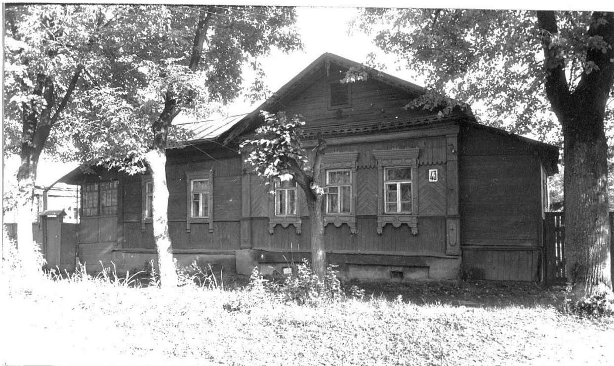
Почтовая ул., 43. Дом жилой, конец XIX – XX вв.

Московская область, г. Звенигород. Комплекс застройки ул. Таракановской, середина XIX - начало XX вв. Фото С.А. Никольского, 1987 г.