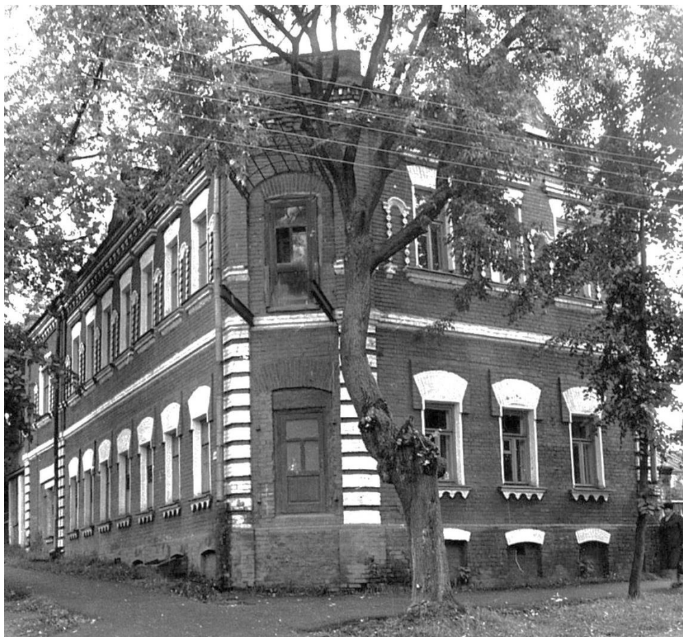
Почтовая ул., 19/16. Дом Соколовых, начало XX в.

Московская область, г. Звенигород. Комплекс застройки ул. Таракановской, середина XIX - начало XX вв. Фото С.А. Никольского, 1987 г.