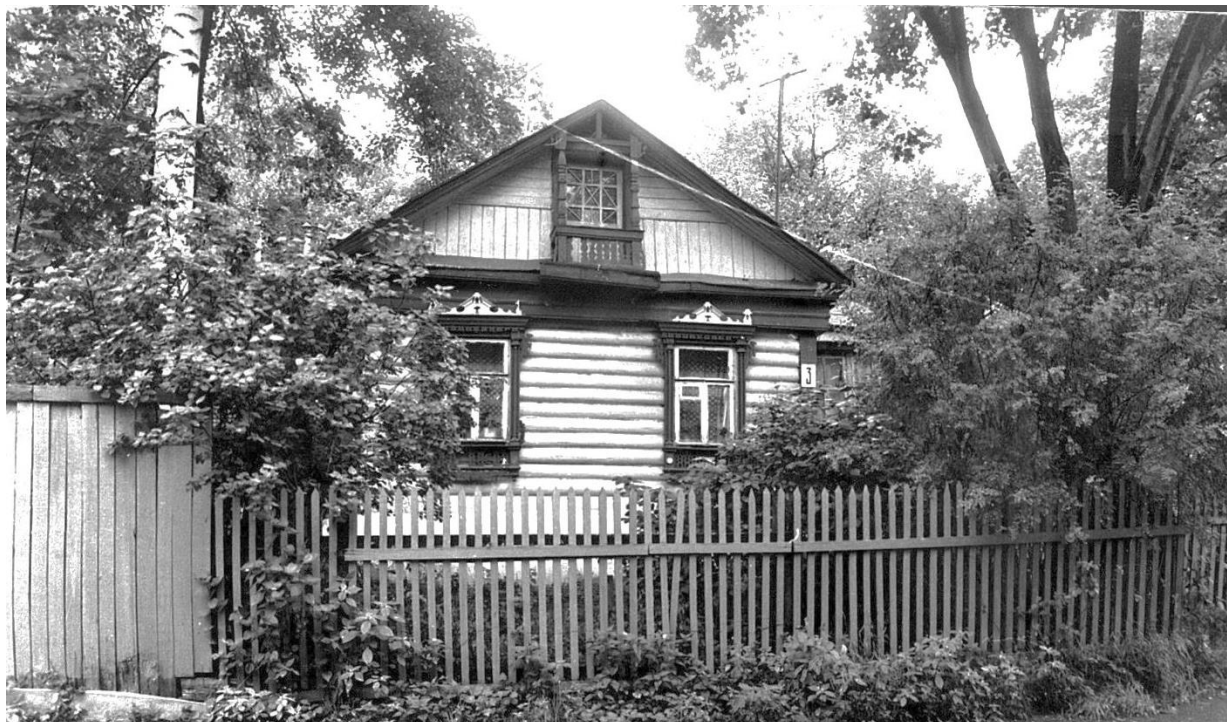
Почтовая ул., 3. Дом жилой, начало XX в.

Московская область, г. Звенигород. Комплекс застройки ул. Таракановской, середина XIX - начало XX вв. 1987 г.