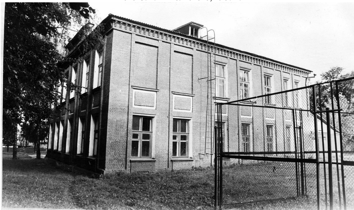
Почтовая ул., 49/8. Женская гимназия, 1885 г.

Московская область, г. Звенигород. Комплекс застройки ул. Таракановской, середина XIX - начало XX вв. Фото С.А. Никольского, 1987 г.