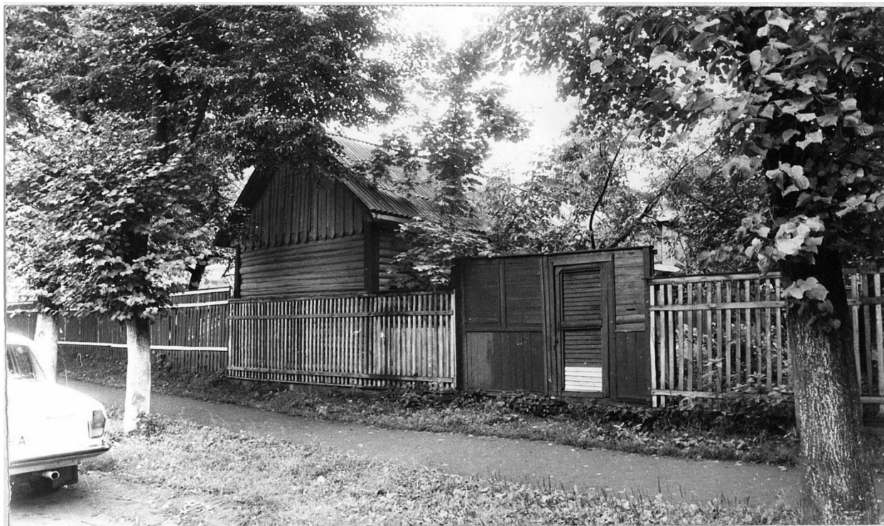
Почтовая ул., 21. Усадьба городская, конец XIX в. Сарай.

Московская область, г. Звенигород. Комплекс застройки ул. Таракановской, середина XIX - начало XX вв. Фото С.А. Никольского, 1987 г.